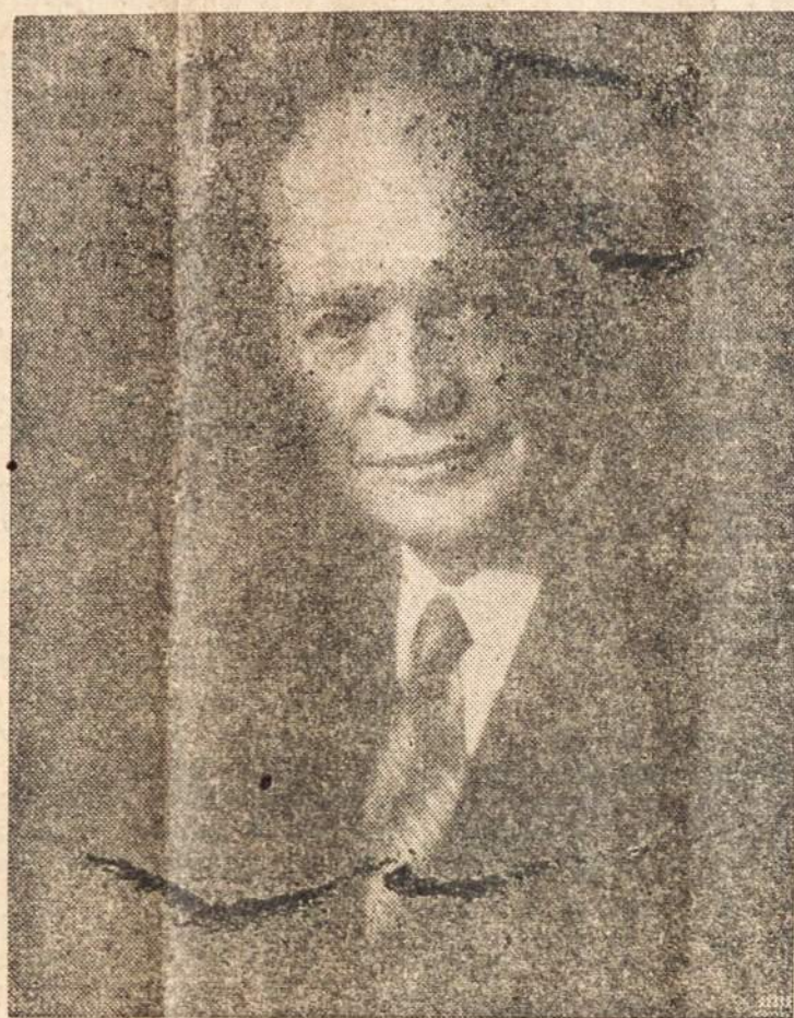
DWIGHT D. EISENHOWER kurio iškilminga inauguracija įvyko sausio 20, 1953

Sausio 18, 19 ir 20 dd., Washingtone įvyko didelės inauguracijos iškilmės. Neskaitant vietinių gyventojų, apie pusę milijono svečių suvažiavo iš visų šalies dalių. Iškilmių programą sudarė bažnytinės pamaldos, atskirų valstybių paradai, pasilinksminimai, parodos, koncertai ir kitokios įvairenybės. Pačios svarbiausios iškilmės įvyko antradienį, sausio 20-tą. Inauguracinės ceremonijos prasidėjo 11:45 A. M. Capital Plazoje. Vice prezidentą Richard M. Nixon priesaikdino senatorius William Knowland iš Californijos, o prezidentą Eisenhower priesaikdino vyriausias U. S. teismo teisėjas Fred Vinson. 1:30 P. M. prasidėjo milžiniškas inauguracijos paradas Pennsylvania Ave., kurs ejo pro prezidento Eisenhower ir kitų aukštų svečių standą įrengtą ties Baltaisiais Rūmais.