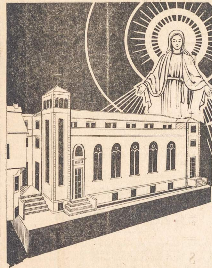
Nekalto Prasidėjimo Seserų naujosios koplyčios projektas, Putnam, Conn.

Iš šios šventovės kilis nuolatinės maldos už jos statytojus-geradarius