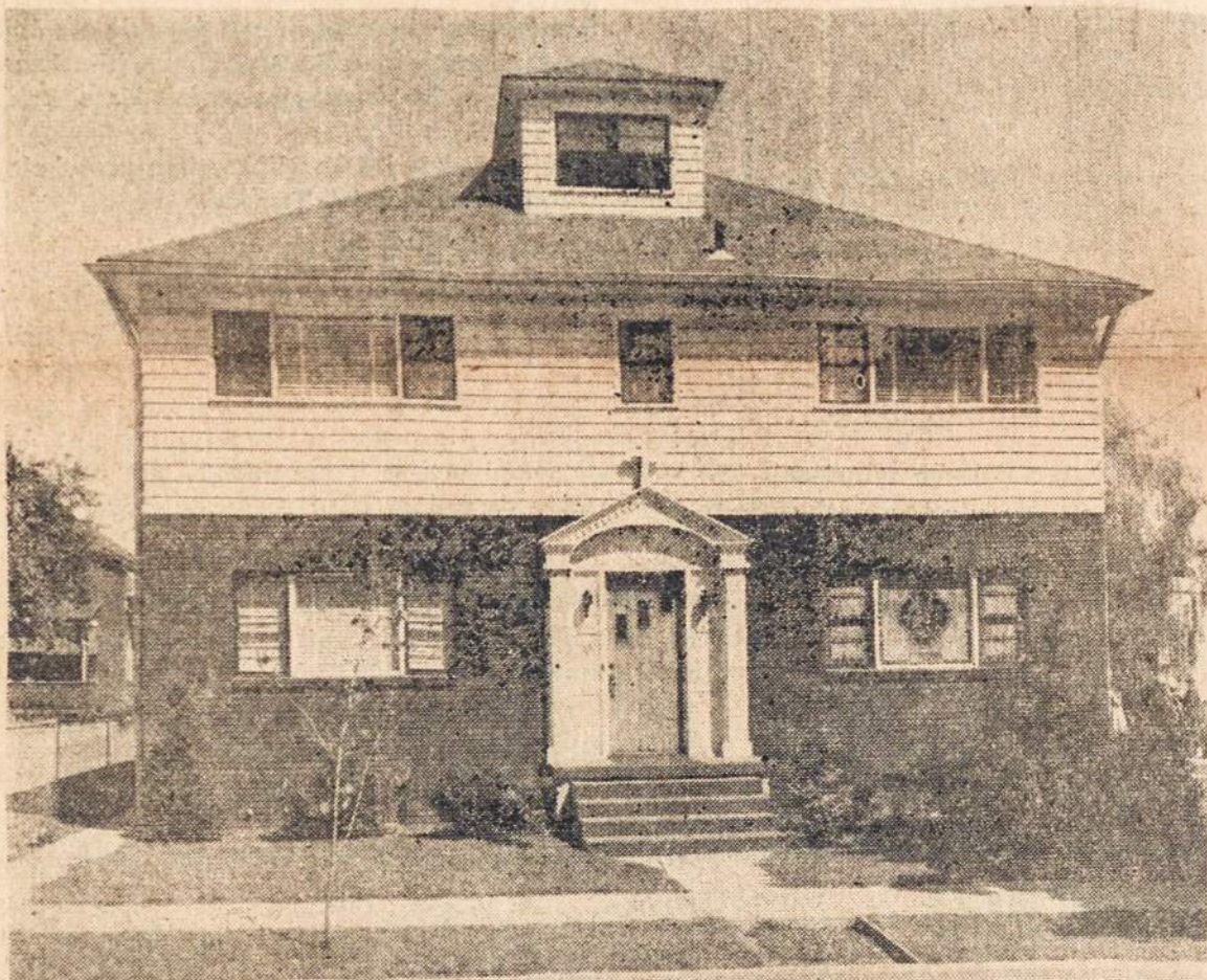
JĖZAUS NUKRYŽIUOTO SESERŲ VIENUOLYNO PATALPOS