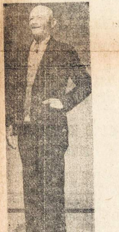
GERB. PONE DAKTARE, Union City, N. J.