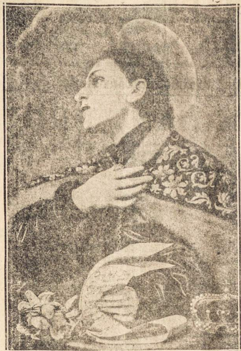
SV. KAZIMIERAS—LIETUVIŲ TAUTOS GLOBĖJAS Jo diena švenčiama kovo 4-tą. Daug Amerikos lietuvių R. K. parapijų yra pasirinkę šv. Kazimiero vardą. Lietuvos Vyčiai taipgi yra pasirinkę jį savo globėju. Dėlto šv. Kazimiero diena daugely vietų iškilmingai švenčiama.