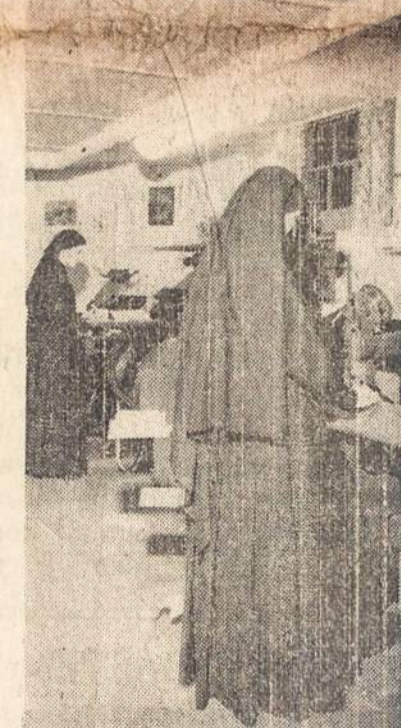
Seselės dirba spaustuvėj