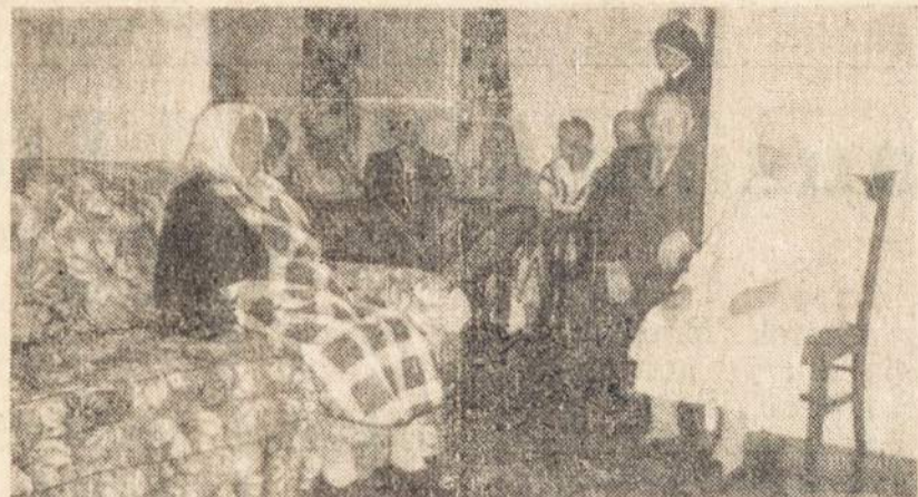
SESELIŲ GLOBOJ—SENELIŲ PRIEGLAUDOJ

Šiandien keliaujate. Norite kiek išsiblaškyti. Prieš jūsų akis vis lekia nauji vaizdai ir nauji žmonės. Staiga nustembat. Kas gi čia? Prieš jūsų akis lietuviškas gamtovaizdis ir sodyba su lietuviškos ornamentikos kryžiumi. Sustojate ir laisviau atsikvepiat. Jūs susikauptat ir galvojat, kur gi čia patekote. Staiga blykstelna mintis,—taigi Nekalto Prasišėjimo Lietuvių Seselių Sodyba ir jų židinys!