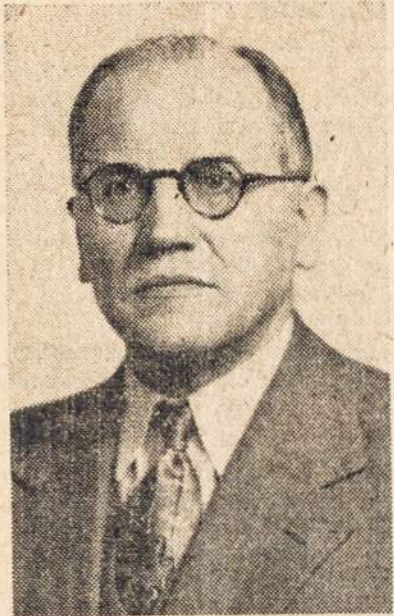
PULKIN. KAZYS ŠKIRPA, buvęs Lietuvos premjeras, paminėjime bus svečias kalbėtojas.

Ši sekmadienį, vasario 18-tą, pittstonečiai minės Lietuvos nepriklausomybės paskelbimo 33-ią metinę sukaktį.