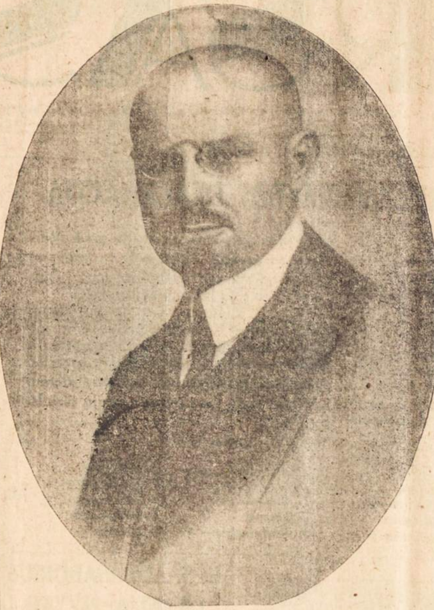
ALEKSANDRAS STULGINSKIS, Antrasis Lietuvos Respublikos prezidentas, Steigiamojo Seimo pirmininkas, Vasario 16-sios Akto signataras. Gimė vasario 27, 1885, mirė kankinio mirtimi 1942 metais, Sibire.

Šie reiškiniai parodo, kad Stalino ir jo gengės politika eina prie bankroto. Maskvos jungo atvirai kratosi Jugoslavijos, Italijos, Čekoslovakijos, Vengrijos ir kitų šalių komunistai, būvę ištikimais jos vergais. Jei tik susidarytų tinkamos sąlygos, tai toks pasipriešinimas atvirai pasireikštų Lietuvoje ir visur kitur, kur tik Maskva turi uždėjusi savo kruviną ranką.