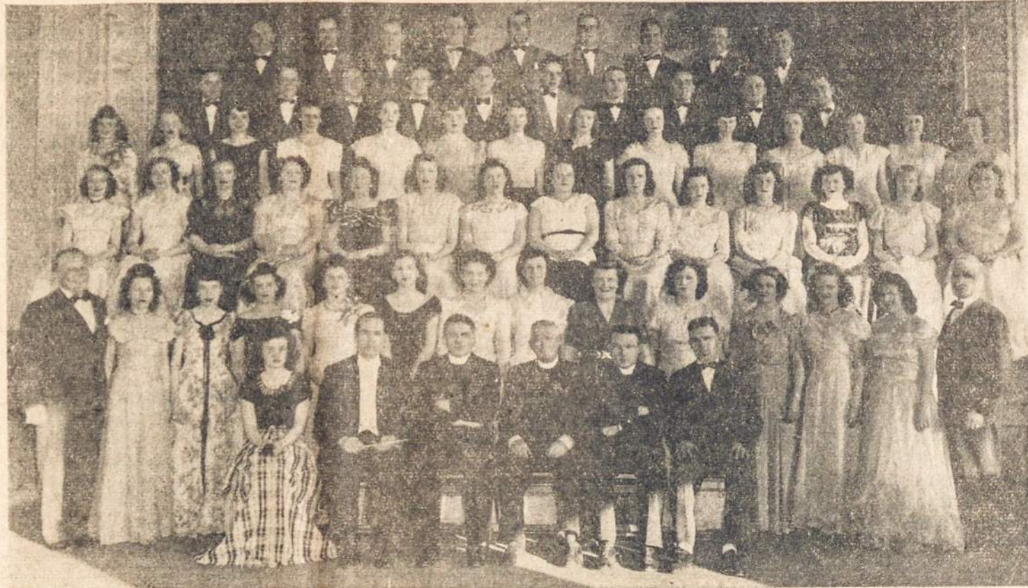
PITTSTON'O ŠV. KAZIMIERO PARAPIJOS CHORAS