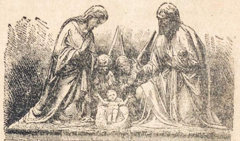
"Sveikas Jėzau gimusis, šventas Dievo Kūdikis!"

MIELIESIEMS SUSIVIENYMO KUOPŲ PAREIGŪNAMS, VEIKĖJAMS, VISIEMS NARIAMS IR BICJULIAMS. TAIPGI "GARSO" SKAITYTOJAMS IR RĖMĖJAMS LINKIME DŽIAUGSMINGŲ KALĖDŲ SVENČIŲ!