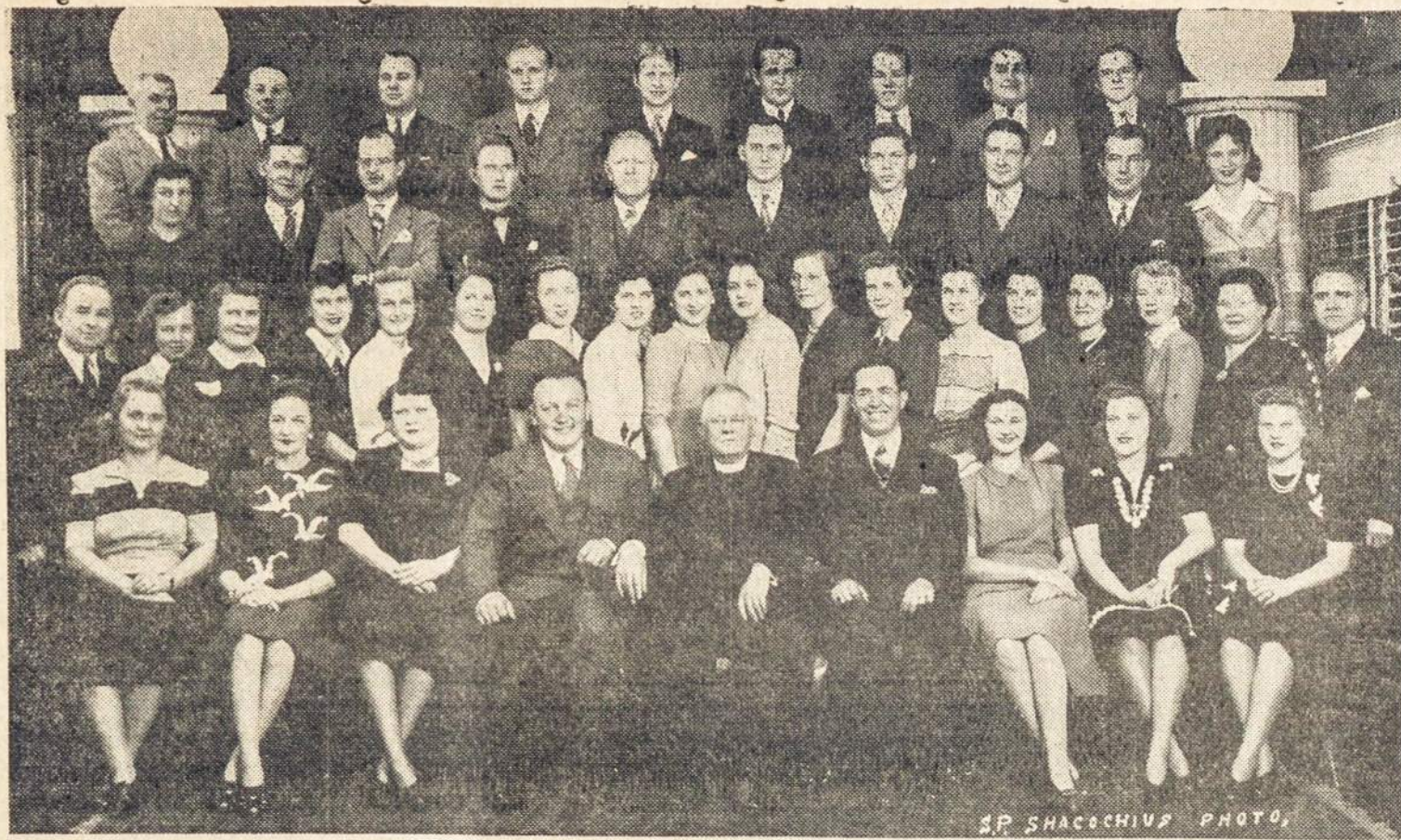
PITTSTONE ŠVENTO KAZIMIERO PARAPIJOS CHORAS,