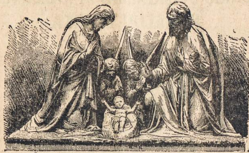
Sveikas, Jėzau Mažiausias, Kūdikėli Brangiausias...