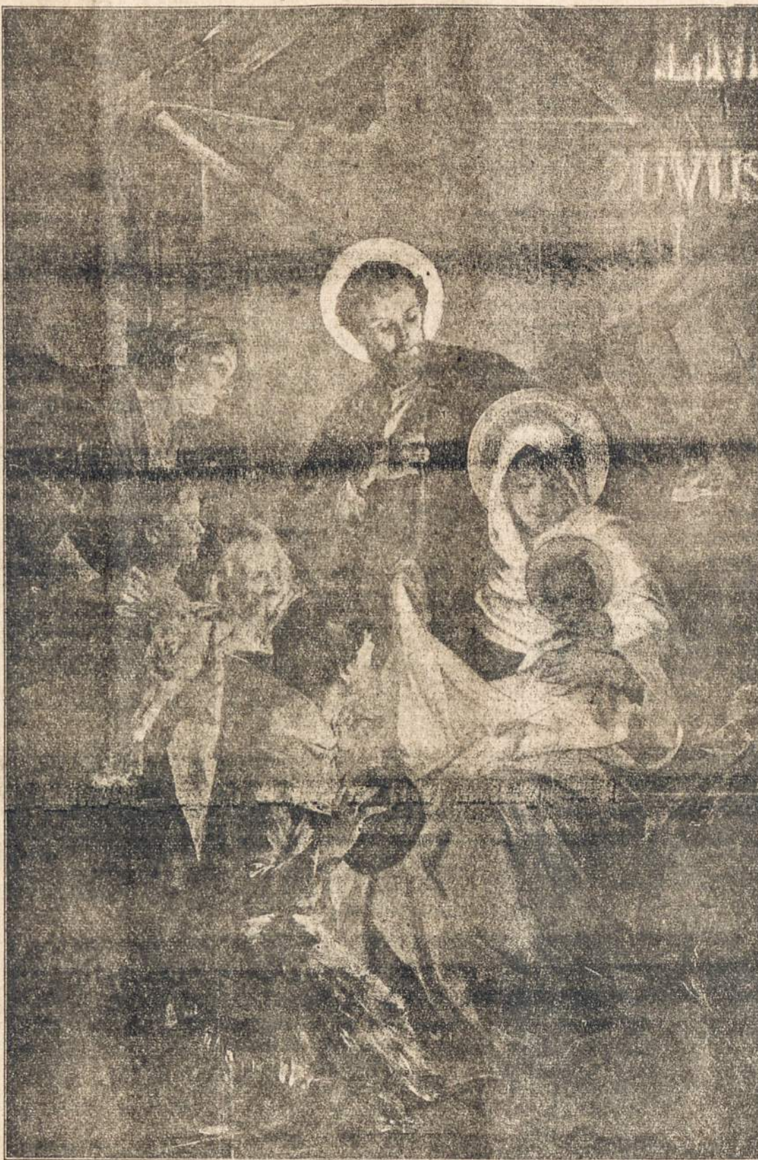
"NUEIKIME Į BETLEJŲ IR PAMATYKIME TAI, KAS ĮVYKO. KĄ VIESPATS YRA MUMS PASKELBĖS".

MEXICO CITY.—Grudžio 15-tą netoli Naranjo traukinio nelaimėje žuvo 17 asmenų, sužeistų 40.