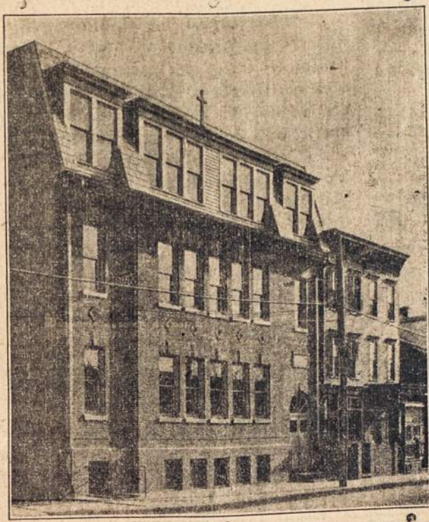
Mahanoy City, Pa., Sv. Juozapo Parapijos Mokykla