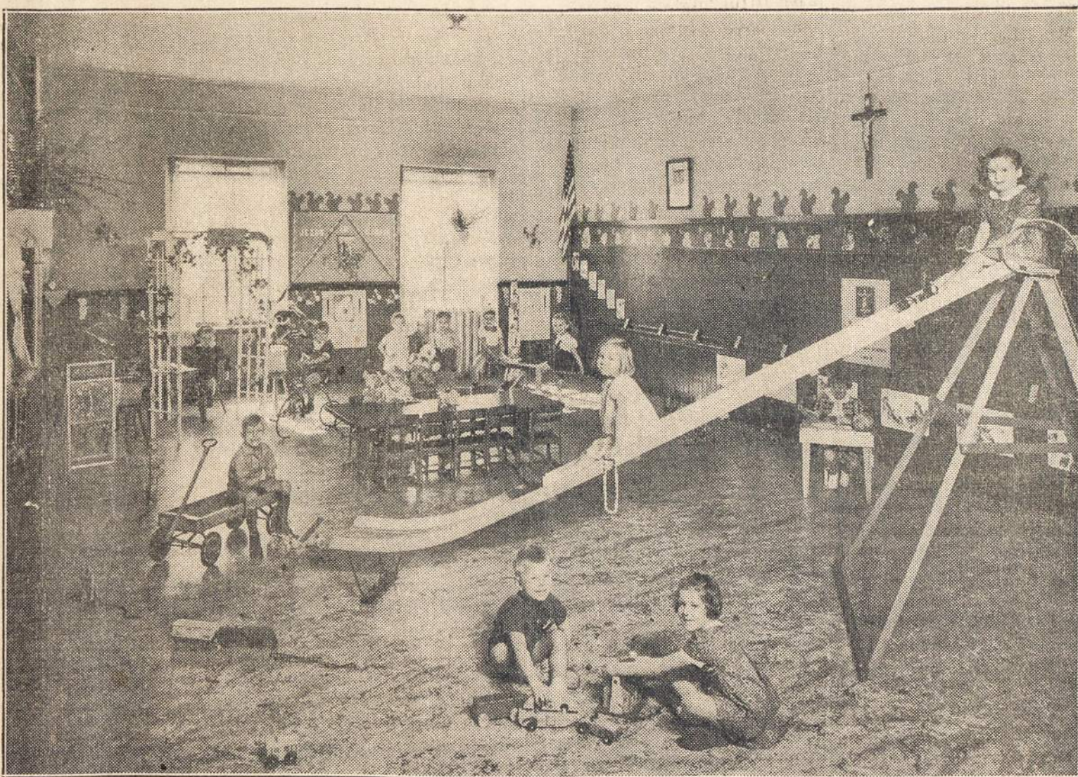
BALTIMORE, MD., LIETUVIŲ ŠVENTO ALFONSO PARAPIJOS MAŽYČIŲ DARŽELIS

Šis paveikslas kalba pats už lyje vaikučiai (berniukai ir mergaitės), taip pat ir jų tėveliai, tės sumanymas įrengti mažyčių ir mamytės. Ypatingai tėvai Alfonso parapijos mažyčių darželį. Linksmai esantys daržėdžiaugiasi, kad jų mažyčiai yra želį, tai turėtų pasiskubinti. Čia tą auklėjimą — tuo geriau.