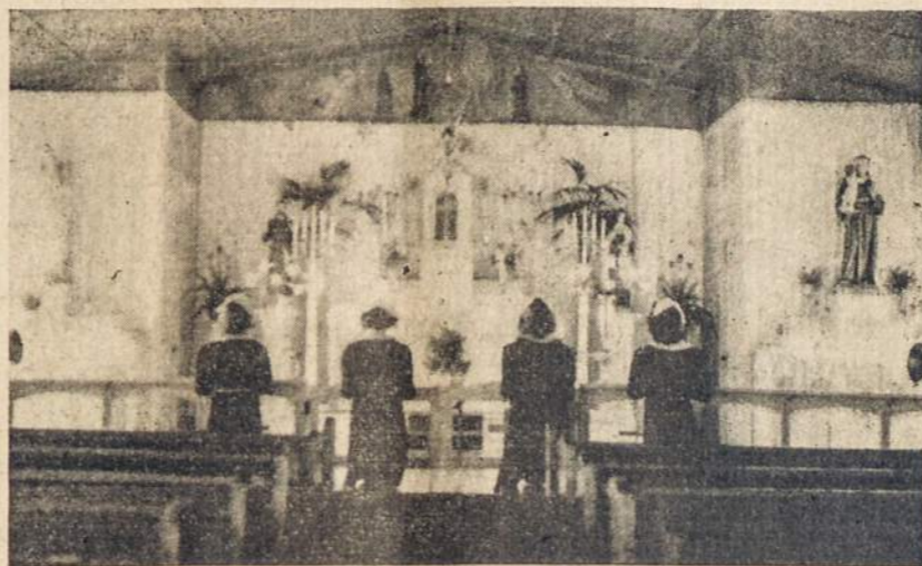
Šv. Pranciškaus Akademikės meldžiasi kopyltėleje.

Brangūs, mylimi globėjai, Seselės mokytojos! Šiandien kada širdy tiek daug liūdno skausmo, mums trūksta žodžių, kuriais galėtume išreikšti savo begalinį dėkingumą... Jūsų rūpestingoj globoj mes buvom toli nuo žemės skriaudų ir neteisybų, ir į naują gyvenimą mes žiūrime su neramiai plakancia širdimi. Ar mes išversim be jūsų vadovavimo visus pasaulio kovų sunkenybes?—O, gal ten mūsų laukia baisi praraja su neviltinga tamsa?.. Tačiau jūsų karžygiškas pasišventimas ir auksa mūsų gerovei, mūsų sielose išaugino tvirtą tikėjimą, viltį ir