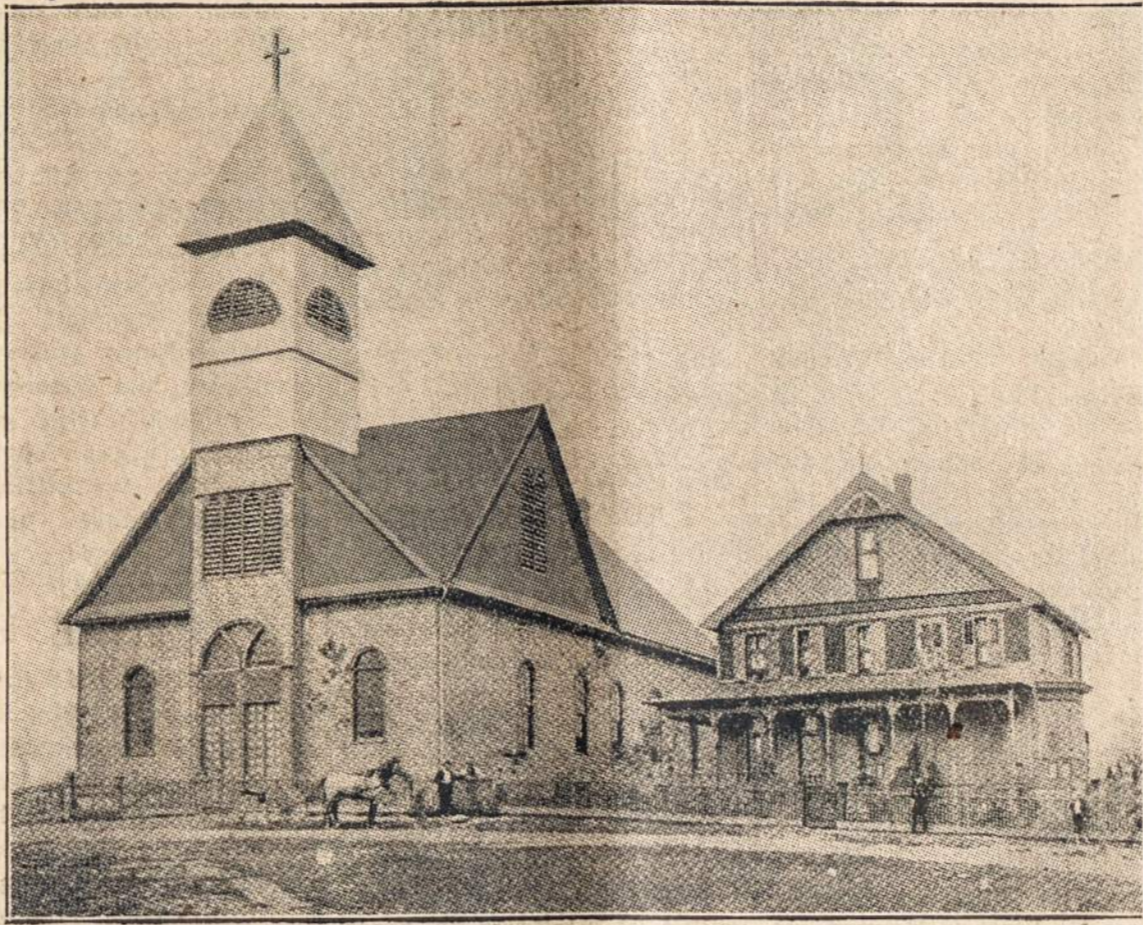
SENOJI ŠV. KAZIMIERO PARAPIJOS BAZNYCIA IR KLEBONIJA