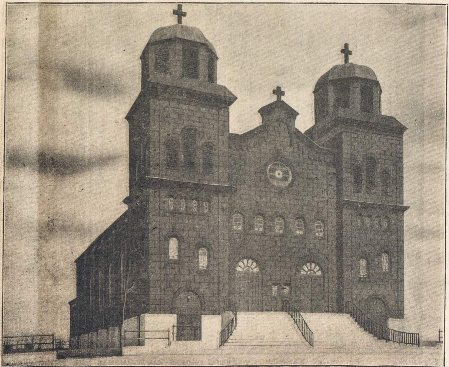
DABARTINĖ PLYMOUTH'O ŠV. KAZIMIERO PARAPIJOS BAZNYCIA.

"GARSO" ADMINISTRACIJA, P. O. Box 32, Wilkes-Barre, Pa.