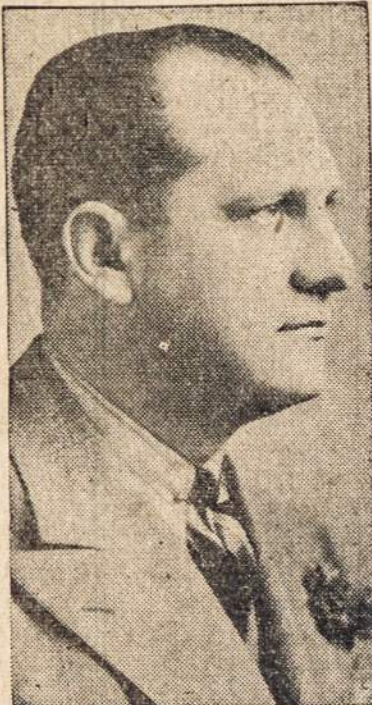
Lackawanna Apskritis (County) Iždininko Vieton Republikonų Tikietu, Trauk Lever 9-F

Seimininkės! Jeigu Jūs Norite Gaminti Gerus Valgius, Gėrimus ir Gerai Seimininkauti, Išigykite Knygą VALGIŲ GAMINIMAS IR NAMŲ PRIŽIŪRĖJIMAS