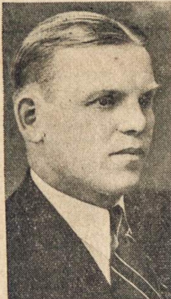
Kandidatas Wilkes-Barre Miesto Kontrolieriaus Vieton

Rugsėjo 12 dieną šių metų įvyksta balsavimai.