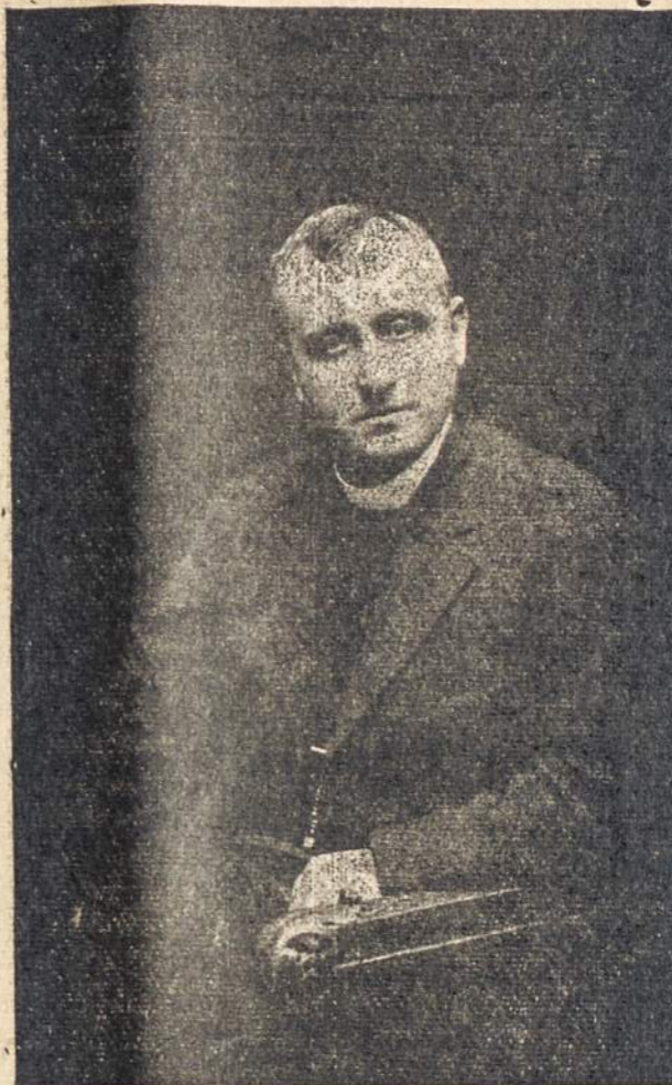
KUN. ANTANAS MILUKAS

Dėl Miluko, dvasininko Ir veikėjo mūsų tautos — Įvykmaus mūsų raštininko Reiškiu jausmus pagarbos.