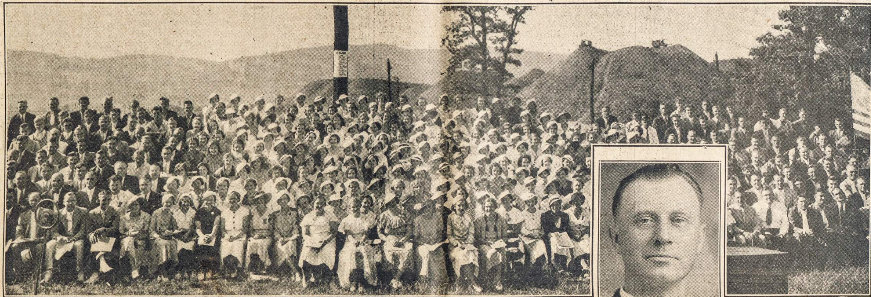
JUNGTINIS WYOMING KLONIO LIETUVIŲ PARAPIJŲ CHORAS, KURIS IŠPILDYS PUKIĄ DAINŲ PROGRAMĄ. DIRIGUOS

BUS IDOMI MUZIKOS, DAINŲ IR KALBŲ PROGRAMA. RENGĖJŲ STANDOSE UŽKANDŽIAI IR GĖRIMAI. ĮŽANGA VELTUI