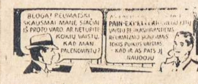
Naujogamas visame pasaulyje nuo 1867 metų

GLIDDEN PAINT STORE 224 Wyoming Ave. Phone 4-1282 Scranton, Pa.