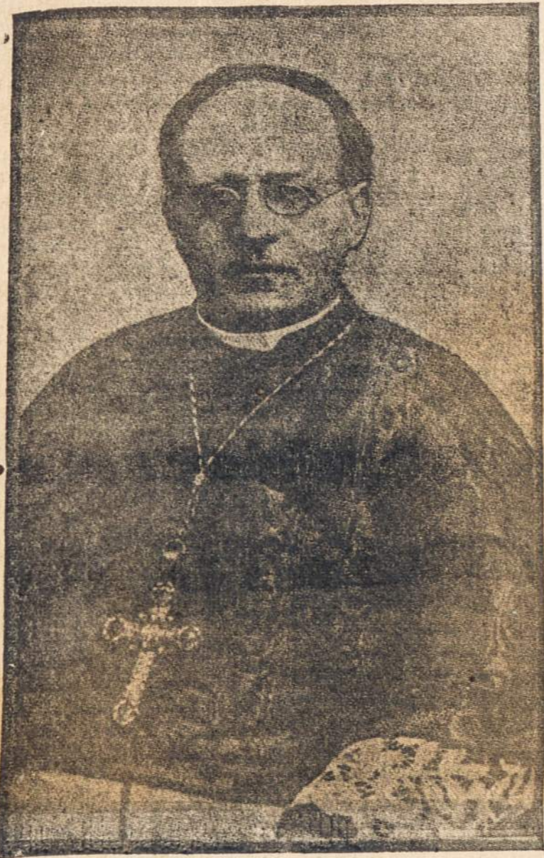
Šv. Tėvas Popiežius Pijus XI.