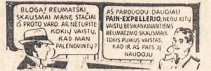
Naudojamas visame pasaulyje nuo 1867 metų