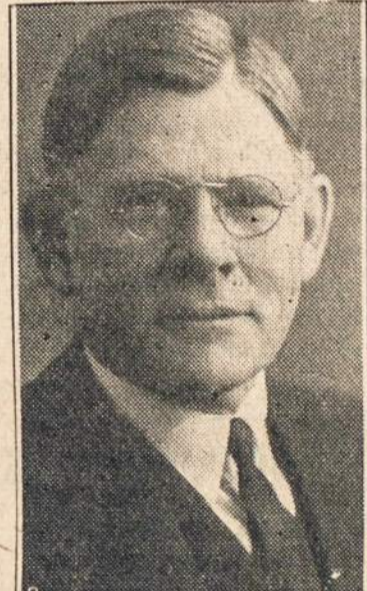
TEISĖJAS A. H. JAMES, išrinktas Penna Gubernatorius

Rinkimų daviniai Pennsylvanijoj taip išrodo: