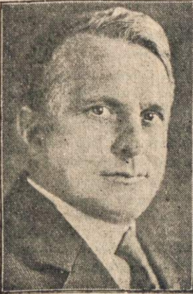
JAMES J. DAVIS, perrinktas U. S. Senatan

Lapkričio 8-tą šios šalies piliečiai rinko daug naujų valdininkų—gubernatorių, senatorių, kongresmenų ir steigų legislatorių. Vienok į šį numerį pilnų davinį dar negalime paduoti, jie bus kitam numery. Pennsylvaniečiai išsirinko steito vyriausybę—gubernatorių, vice gubernatorių, vidaus reikalų sekretorių, U. S. senatorių, 34 kongresmenus, 26 steito senatorius ir 208 atstovų buto narius.