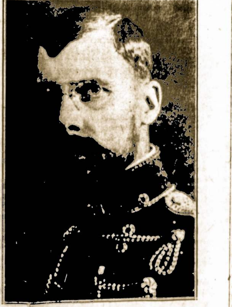
ATSARGOS GENEROLAS P. PLECHAVIČIUS, pasiūlymą Lietuvos nepriklausomybės kovose, ypač prieš bolševikus ir bermontininkus; buvęs Lietuvos kariuomenės vyriausiojo štabo viršininkas.

Susisiekimas orlaiviais Lietuvoje mažai brangesnis už susisiekimą geležinkeliais, todėl orlaiviais keleivių niekuomet netrūks.