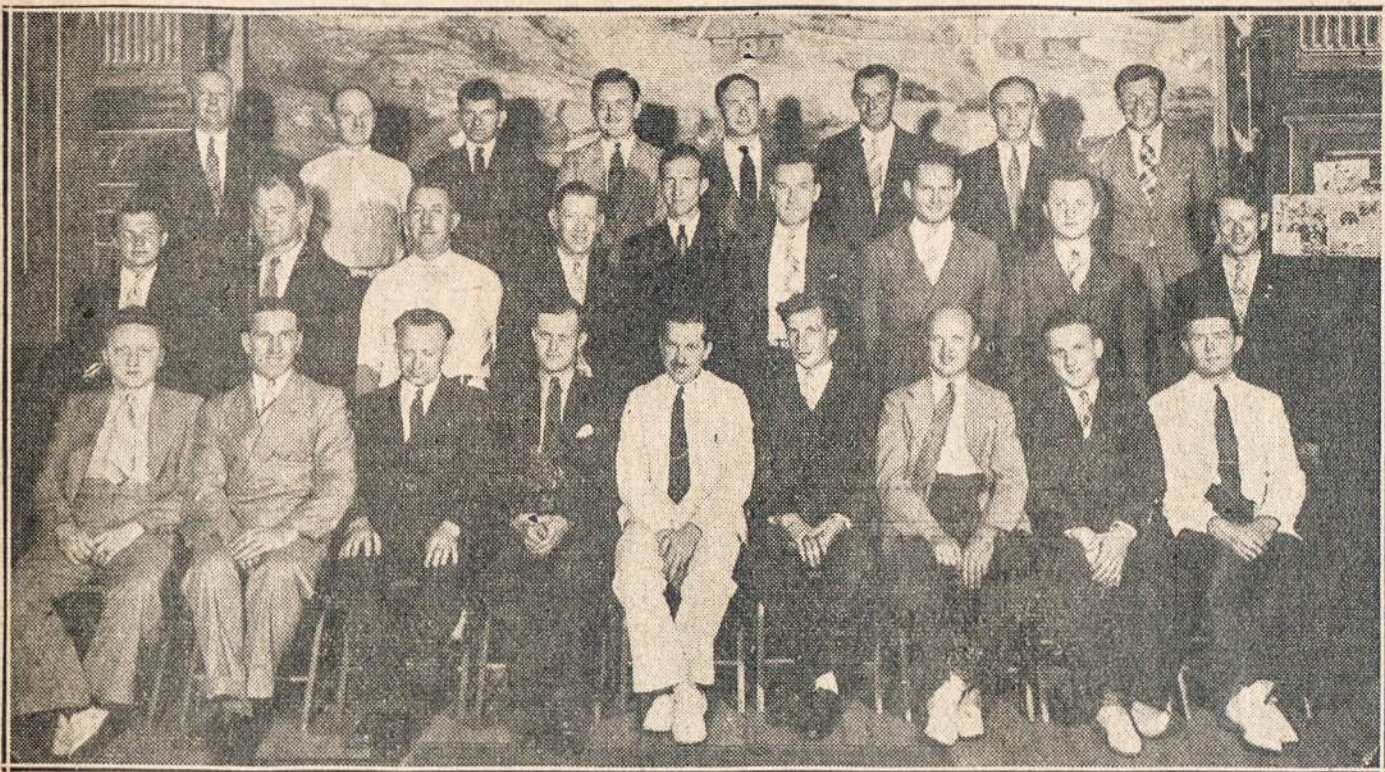
24-TOS LIETUVIŲ DIENOS KOMITETO NARIAI

SCRANTON, Pa.—The Third National Bank and Trust Co., viena iš vadovaujančių bankinių įstaigų šiame rajone, kviečia lietuvius skaitytos ateit ir išdiskusuoti jūsų problemas; jie turi reikalingus fondus ir su malonumu teikia tikras paskolas. Nėra skirtumo, ar jūsų biznis didelis ar mažas. The Third National Bank and Trust Co. kviečia jus išpildyti aplikaciją paskolos gavimui. Šio banko viršininkai yra gerai žinomi visose Lackawanna ir gretimose apskrityse dėl jų gerų bankinių principų. Jie visomet pasirengę mielai padėti jūsų finansinėse tranzakcijose su pirmos ratos informacijomis igydomis daugelio metų patyrimu. The Third National Bank ir Trust Co. suteikia visus patarnavimus visuose bankiniuose reikaluose šiame rajone; priėmė to The Third National Bank ir Trust Co. yra geras bankas darymui jūsų bankinio gėris.