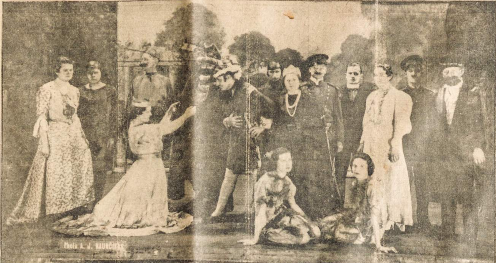
VEIKALO "KANTRI ELENA" VAIDINTOJAI

Motina (vaikui): Kam tu muši savo sesutę? Vaikas: Mes žaidėme "Adomas ir Ieva," bet ji, negundžius manęs, pati obuolį suvalgė.