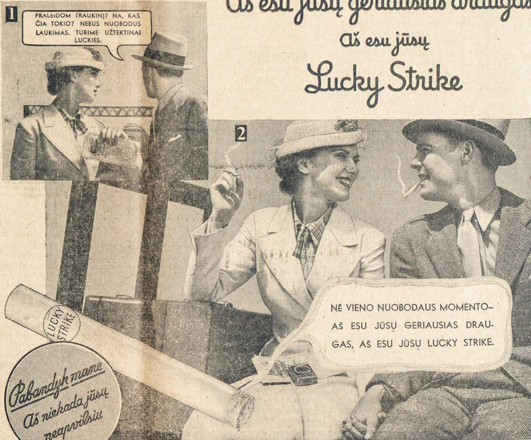
Copyright 1935, The American Tobacco Company

KAS SVARBIAUSIA, TAI KOKS TABAKAS Niekur nėra puikesnio tabako kaip tas, kuris naudojamas Luckies