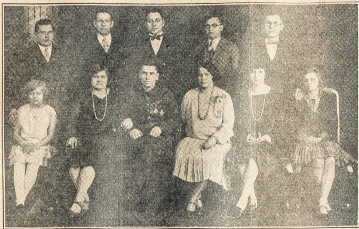
GRUPĖ PHILADELPHIJOS LIETUVIŲ VEIKĖJŲ (FOTOGRAFUOTA 1928 METAIS).

CLEVELAND, Ohio. — 307 kp. susirinkimas bus balandžio 12 dieną, 8 val. vakaro P. šv. Nesiliaujančios Pagalbos par. svet. Visi nariai dalyvaukite.