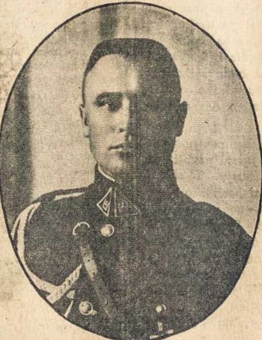
ATS. GENEROLAS KAZYS LADYGA.

Amerikos lietuvių Tarybos iniciatyva 1918 m. sušauktas politiškas lietuvių seimas New Yorke, kuriame išneštos svarbios