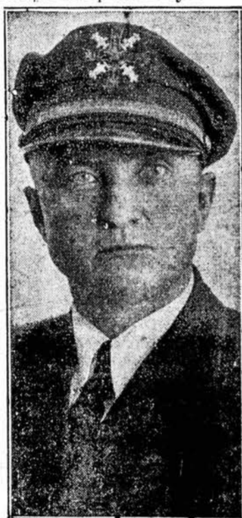
Kap. Steponas Darius