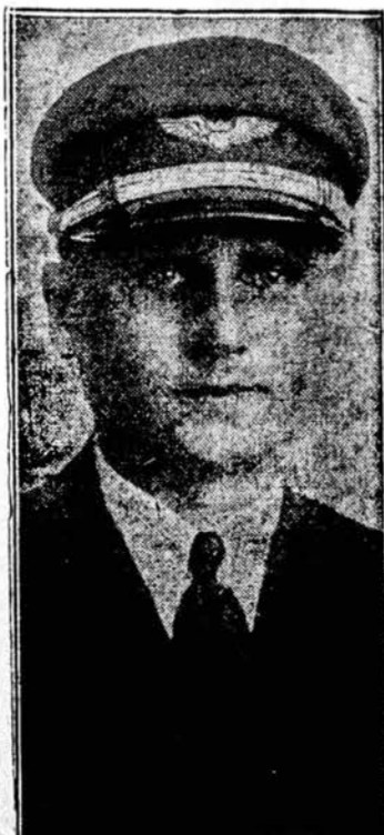
Leit. Stasys Girėnas

12:30 A. M., Kuldamm apylinkėje, arti Soldino miškų, tulas