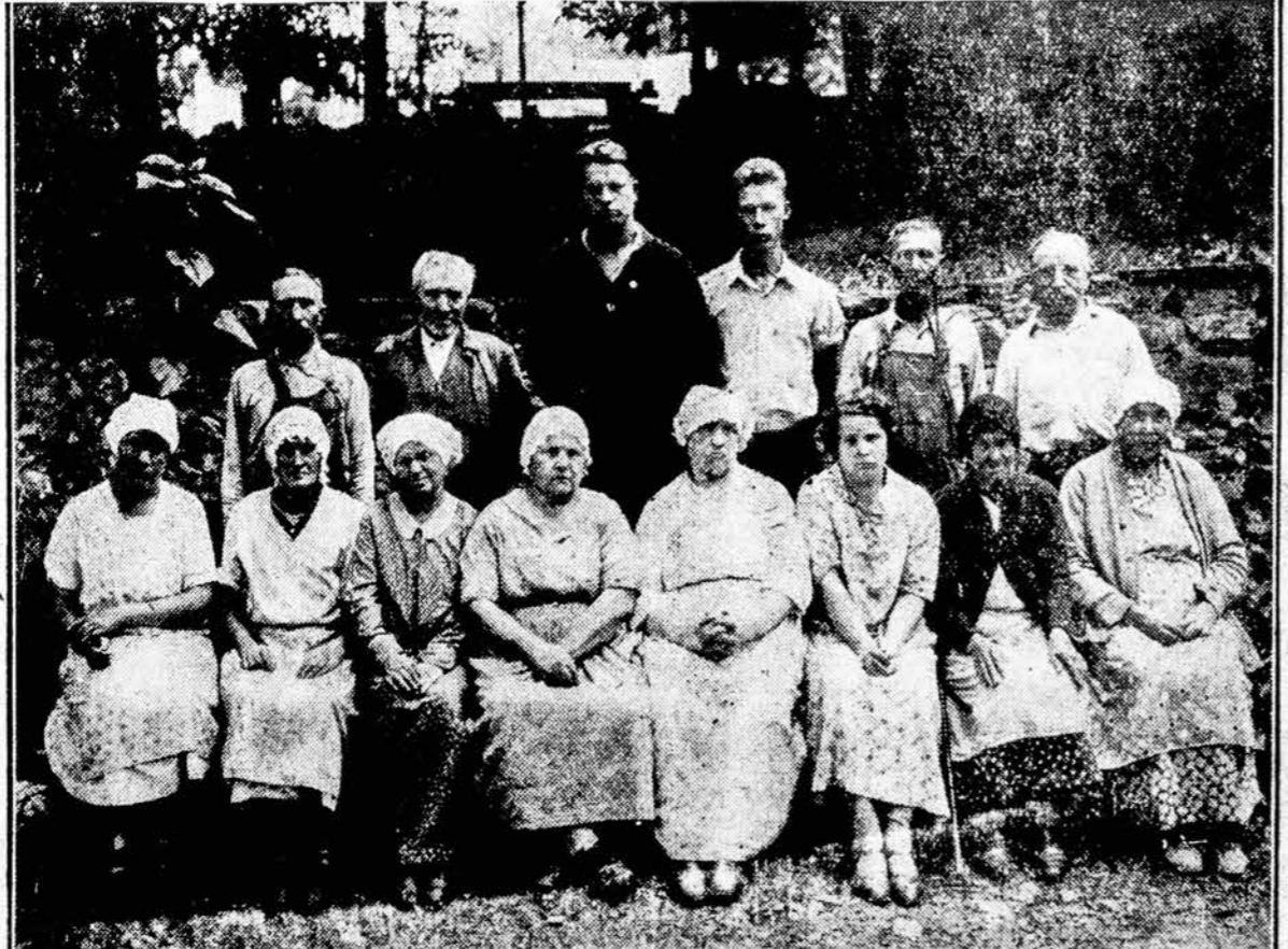
Dalis, lietuvių senelių Elmhurst'o prieglaudoj, kurių šelpimui yra reikiama Wyoming Klono Lietuvių Diena.