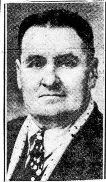
A. A. P. P. ULPIS