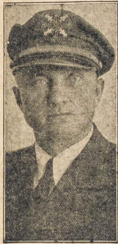
Kapit. Steponas Darius