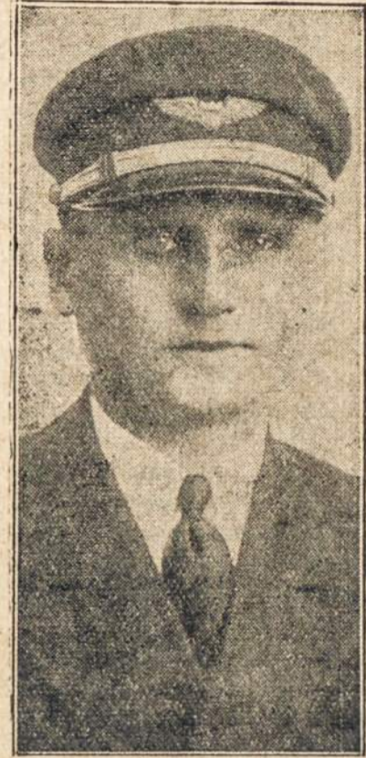
Leit. Stasys Girėnas

1933 metais liepos 15-tą, 6:24 ryto, iš Floyd Bennett aikštės, New Yorke, orlaiviu Lituania kapitonas Steponas Darius ir leit. Stasys Girėnas pasikėlė kelionėn, kad be sustojimo nuskristi į Kauną. Tačiau liepos 17-tą 12:30 nakties Vokietijos miške, netoli Soldino, jiedu su Lituania nukrito žemyn ir žuvo. Viso jiedu per 36 valandas nukrido 4,500 mylių ir iki pačiam Kaunui pasiliko skristi tik 75 mylios. Jų didelis rekordas, atsiektas aviacijos srity, jų misteriskomis miglomis apsupta mirties priežastis, sudomino visą civilizotą pasaulį. Gi lietuvių tauta juodu įrašė į savo didvyrių eiles.