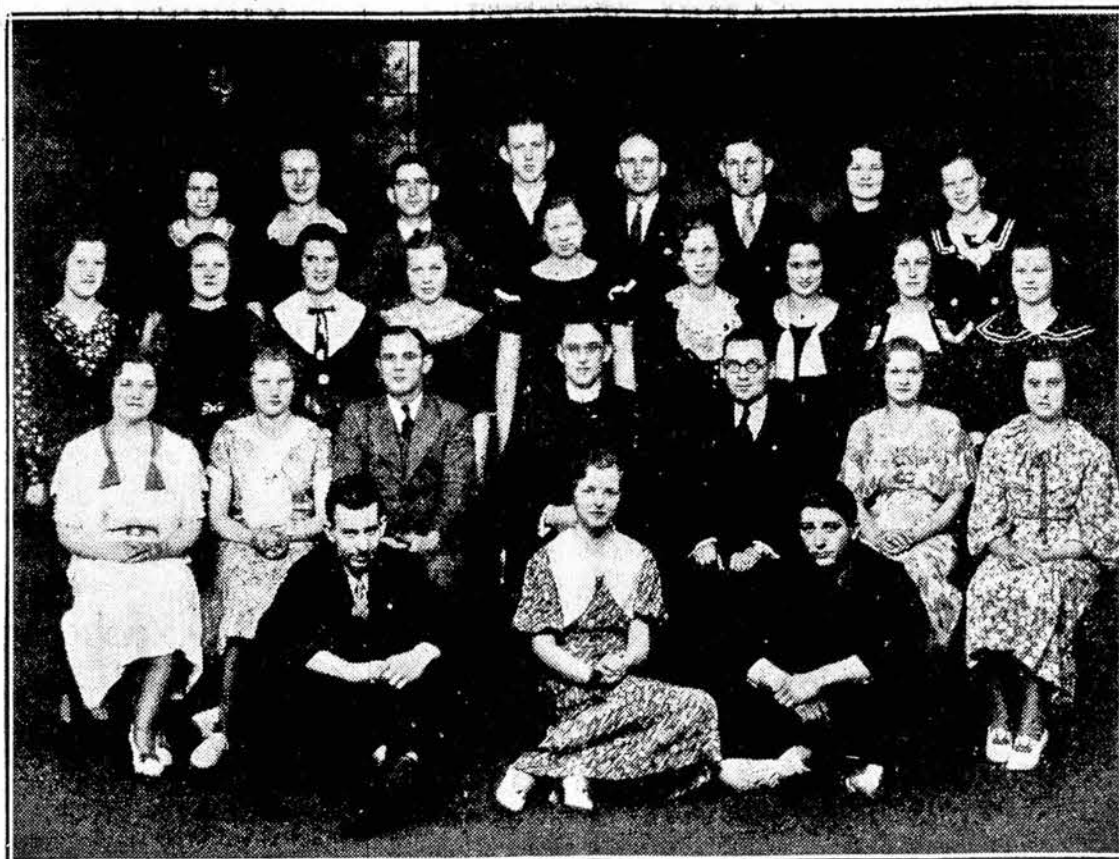
ŠV. MYKOLO PARAPIJOS CHORAS W. SCRANTON, PA.