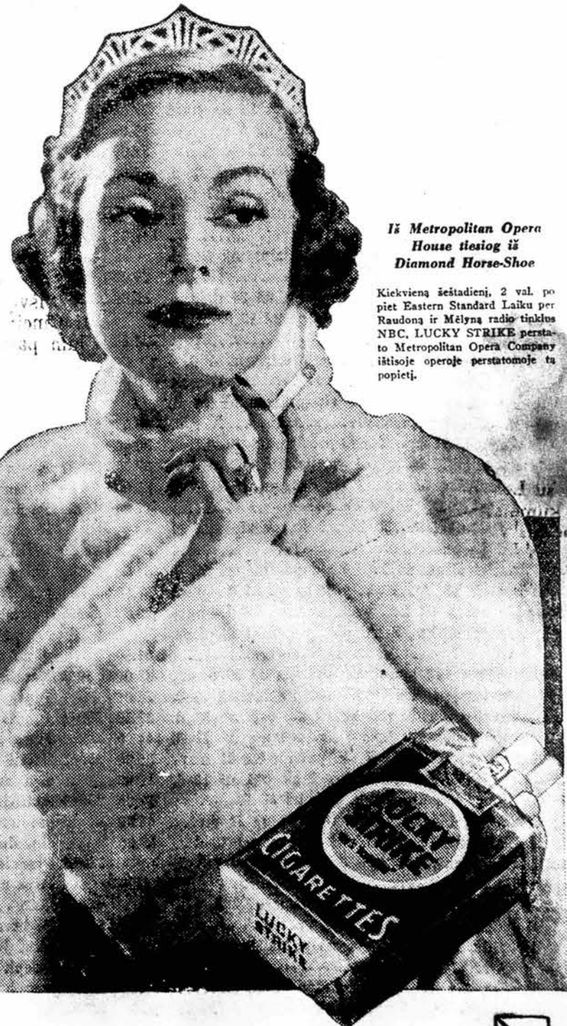
Iš Metropolitan Opera House teatro šio Diamond Horse-Shoe

Kiekvieną šeštadienį, 2 val. po piet Eastern Standard Laiku per Raudoną ir Mėlyną radio tinklus NBC, LUCKY STRIKE perstato Metropolitan Opera Company litošioj opere perstatomoje tu popietei.