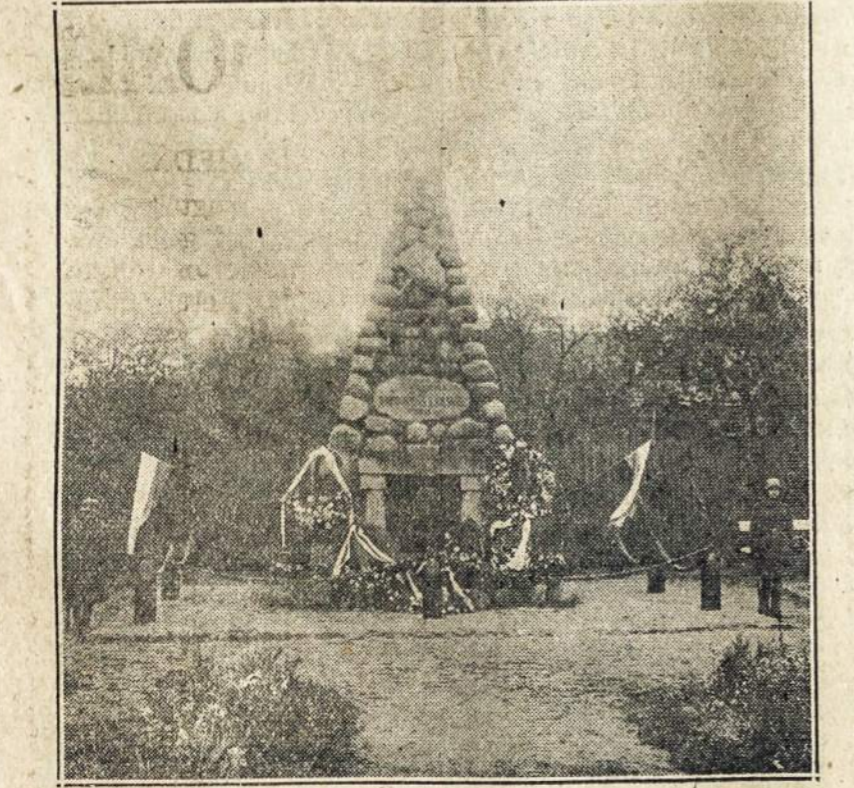
PAMINKLAS KRITUSIEMS UŽ LIETUVOS LAISVĖ IR NEPRIKLAUSOMYBĖ. KAUNAS, KARO MUZIEJAUS SODAS.