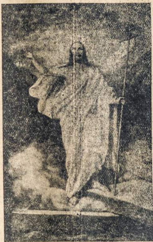
KRISTUS KELĖS! ALELIUJA!