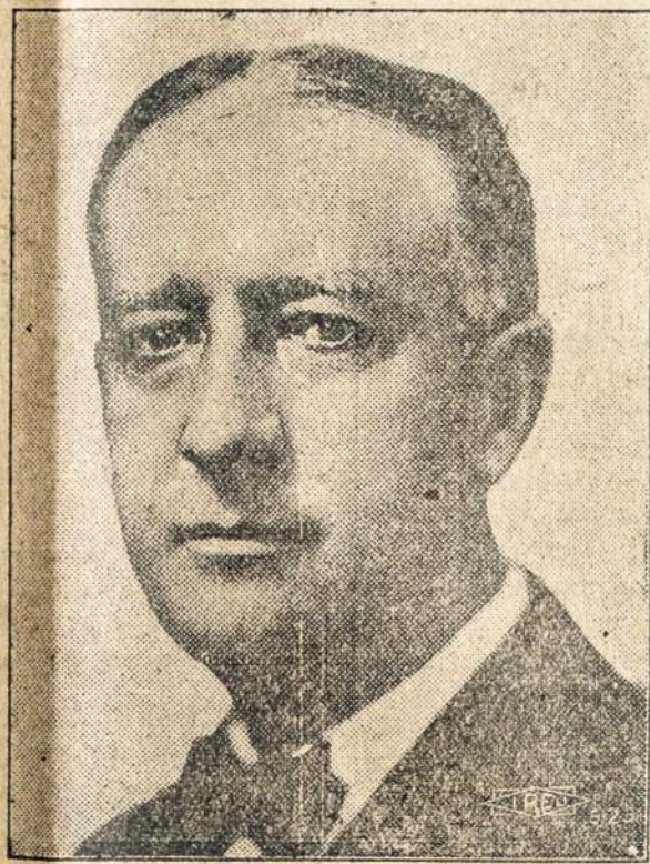
ALFRED E. SMITH.

garsus politikas, oratorius; buvęs New York steito gubernatorius, 1928 metų demokratų partijos kandidatas į Prezidento vietą. Jo rėmėjai karštai ragina jį vėl sugrįžt į politišką veikimą ir būsimuose rinkimuose kandidatuot į senatoriaus vietą, arba į New Yorko miesto majoro.