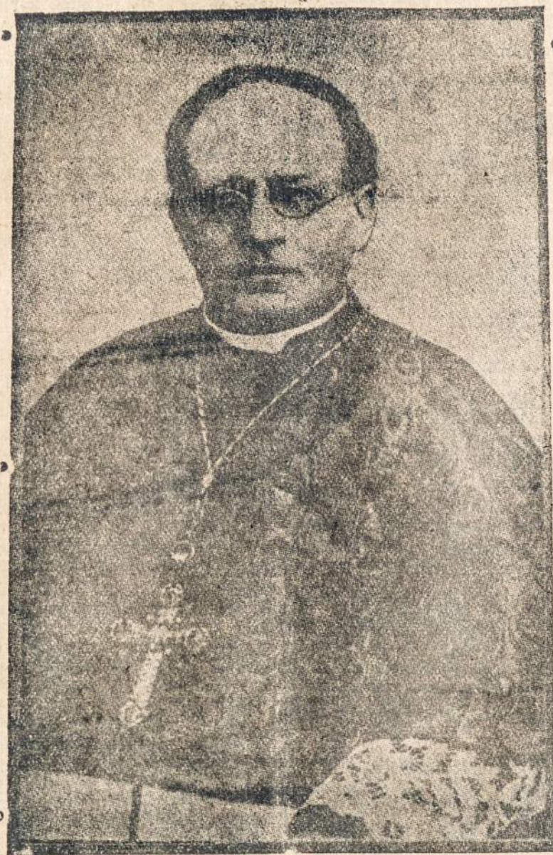
SV. TĖVAS POPIEŽIUS PIJUS XI-SIS.

Lodz, Lenkija.—Balandžio 9-tą žydai demonstrantai išdaužė akmenimis vokiečių konsulato langus, taip pat atakavo vokiečių laikraščio, knygyno ir mokyklos įstaigas.