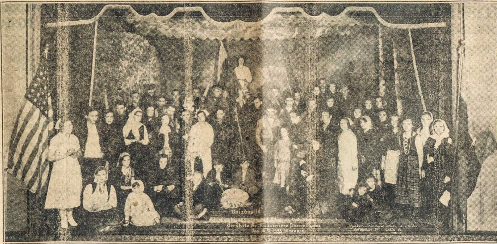
PHILADELPHIJOS ŠV. KAZIMIERO PARAPIJOS CHORAS, VAIDILOS,