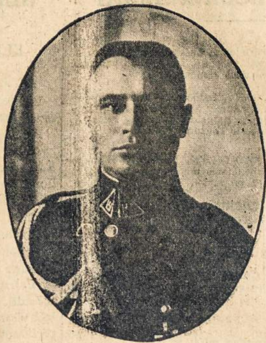
GENERALAS KAZYS LADYGA, 1920 m. buvęs kariuomenės vadas.

Laiko Dvasia: ... Matai — senolių didvyrių dvasios suteikė Lietuvai sapną. Ir kaip nuostabiai greit pakyla tauta dar vakar miegojusi gilų miegą. Ar girdi — jau skamba laisvės daina!