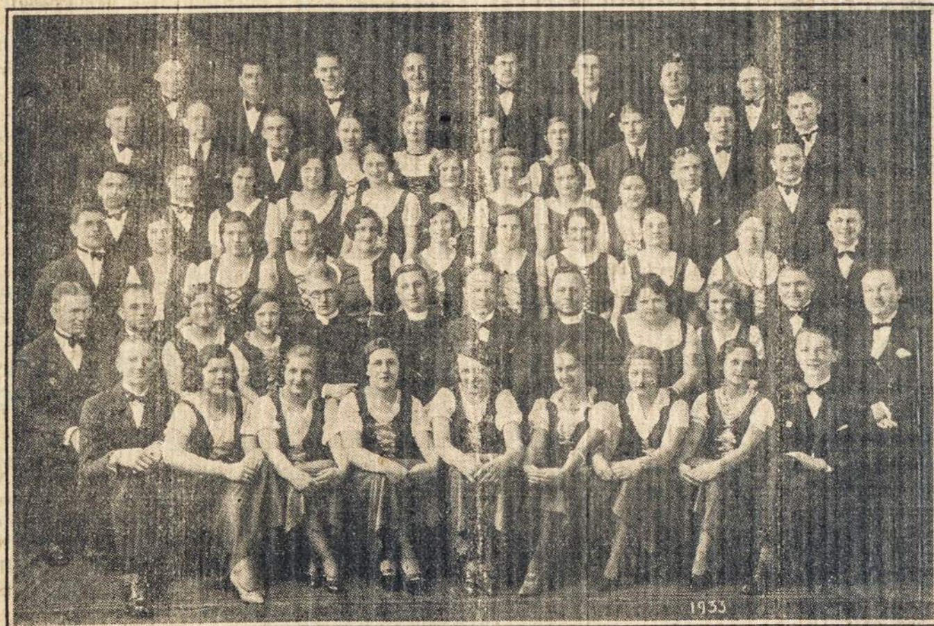
OPERETĖS "LIETUVAITĖS" VAIDYLOS BEI CHORAS, WATERBURY, CONN. (Žiūrėk korespondenciją)

Informaciją klauskite pas vietinį agenta arba HAMBURG-AMERICAN LINE 39 BROADWAY, NEW YORK