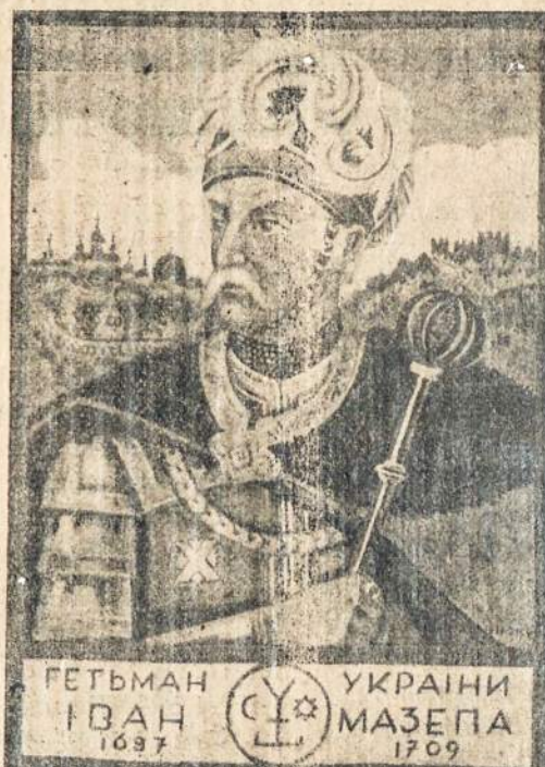
(Jo 300 metų gimimo sukaktuvių paminėjimas)

PHILADELPHIA, Pa.—Sausio 28-tą, šiu, 1933 metų, milžiniškoje svetainėje "Metropolitan Opera House" įvyko grandioziais meno vakaras suruoštas paminėjimui 300 metų gimimo sukaktuvių Ukrainos kuo garsiausio didvyrio — kovotojo už nepriklausomybę — kunigaikščio Jono Kolėdyskio—Mazepos.