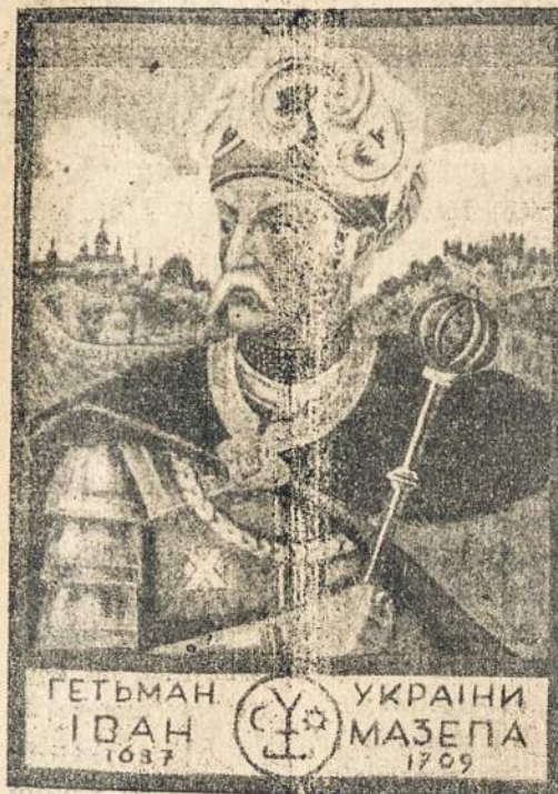
(Jo 300 metų gimimo sukaktuvių paminėjimas)

PHILADELPHIA, Pa.—Sausio 28-tą, šiu, 1933 metų, milžiniškoje svetainėje "Metropolitan Opera House" įvyko grandioziasis meno vakaras suruoštas paminėjimui 300 metų gimimo sukaktuvių Ukrainos kuo garsiausio didvyrio — kovotojo už nepriklausomybę — kunigaikščio Jono Koldedynskio—Mazepos.