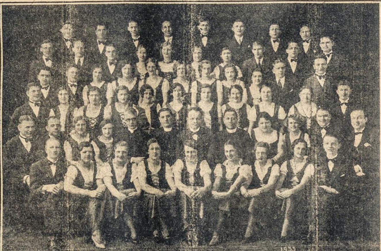
OPERETES "LIETUVAITES" VAIDYLOS BEI CHORAS, WATERBURY, CONN. (Žiūrėk korespondenciją)

Moderninis, patogus ir kitų neviršijamas visose klasėse patarnavimas. Savaitiniai išplaukimai iš New Yorko. Patogus ir greitas geležinkeliu susisiekimas iš Hamburgo. VIDUTINĖS KAINOS. Informacijų klauskite pas vietinį agentą arba HAMBURG-AMERICAN LINE 39 BROADWAY, NEW YORK