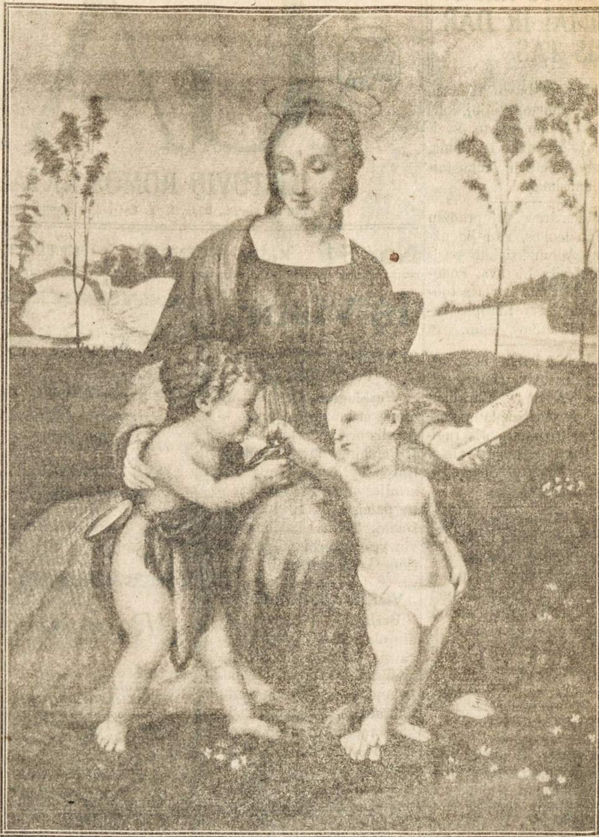
Šis garsaus artisto Rafaelio kūrinys vaizduoja švenčiausią Mariją, Kūdikių Jėzų ir Šv. Joną jų jaunose dienose.

Pernai tuo pat laiku 268 vedybos, gimė 862, mirė 541, gi 1926 m. vedė 240 porų, gimė 856, mirė 531 žmogus. Palyginus su praėjusiais metais, šiemet sumažėjo vedybų skaičius 51, gimimų 84, o mirimų skaičius padidėjo 97. Tuo pat sumažėjo ir žmonių priauglis.