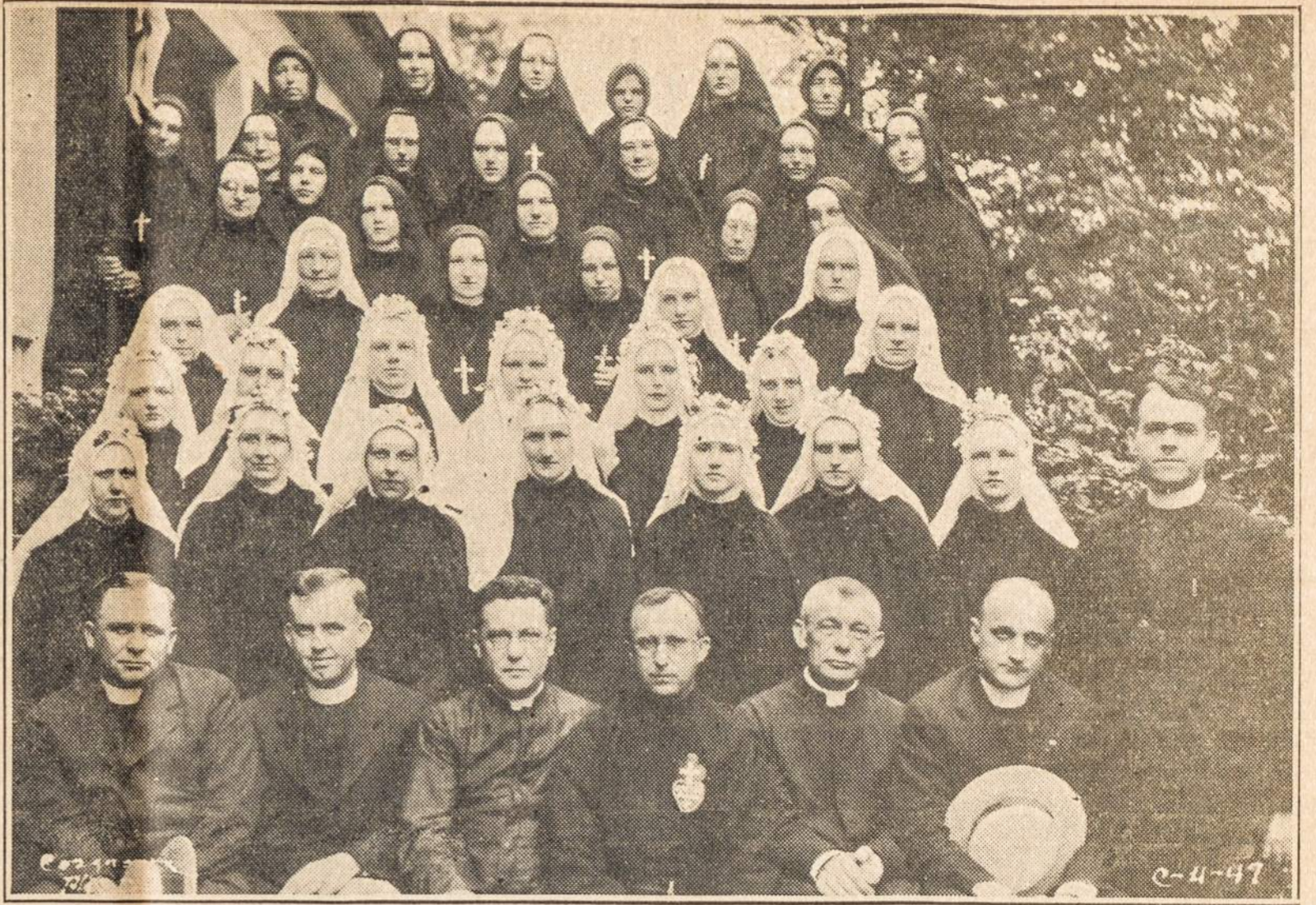
Štai būrelis jaunų mergaičių Jėzaus Nukryžiuoto Seselių pasiaukavusių tarnauti mūsų vargdieniams vientaučiams: našlai- čiams, seneliams ir mokyti vaikelius mokyklose.