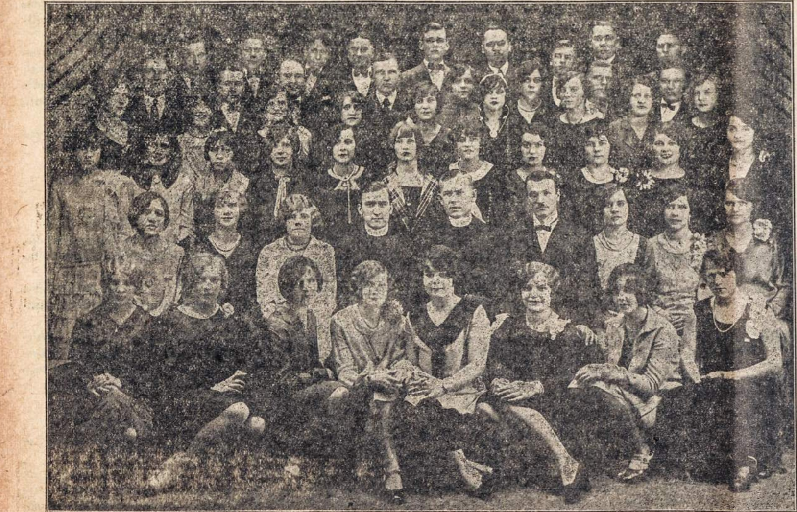
APREISKIMO PAN. ŠV. PARAPIJOS CHORAS, Kurs suvienytomis jėgomis su Liet. Vyčių 110 kp. choru, vadov. muz. A. Visminui, dalyvaus JAUNIMO LIETUVIŲ DIENOS programoj, kurią rengia Liet. Vyčių N. c. ir N. J. Apskritis pirmadieny, Rugsėjo 3 d., (Labor Day), 1928 m., Klaščiaus Clinton Parke, Maspeth, N. Y. Koncerto pradžia 5 val. po pietu. Be choro dalyvaus žymūs solistai.