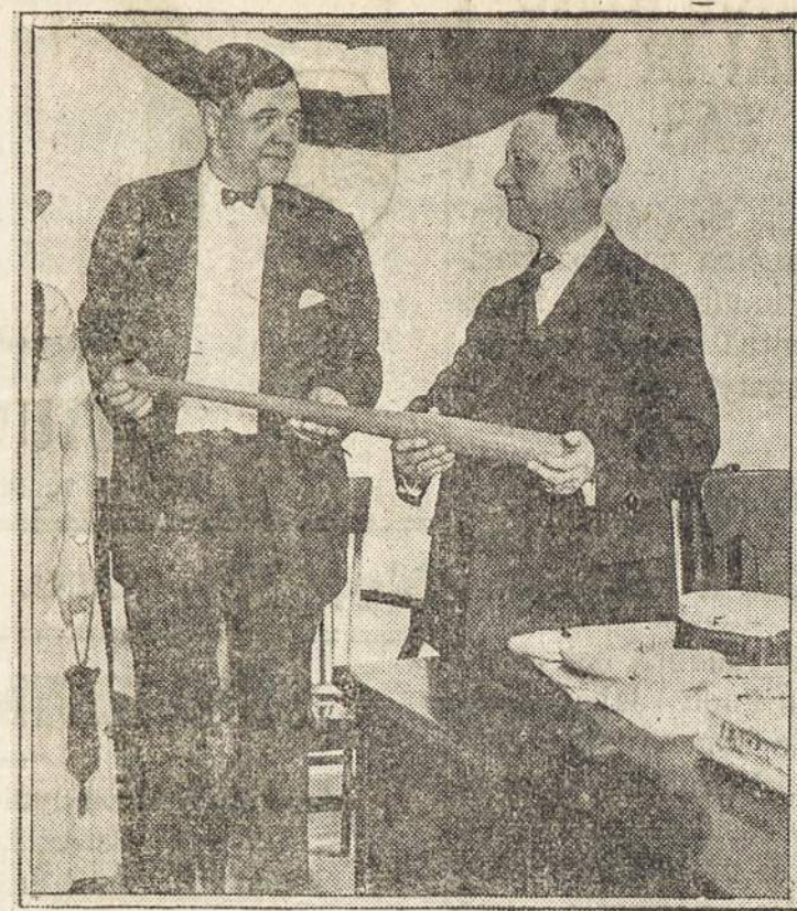
BABE RUTH IR AL. SMITH.

Nuo kokių priežasčių, manome ir pats oficiozas svokvia, nes 107 Nr. vedamajame: "Spaudos sutvarkymo belaukiant" galvoja, nors ir savotiškai, apie cenzūros panaikinimą. Tik gaila, kad mūsų spaudos padėtį oficiozas pradėjo kreipti dėmesio tada, kai užsienių biznierių pasiryžo šią padėtį išnaudoti, ir kai "Lietuvos Aidas" gavo ant-