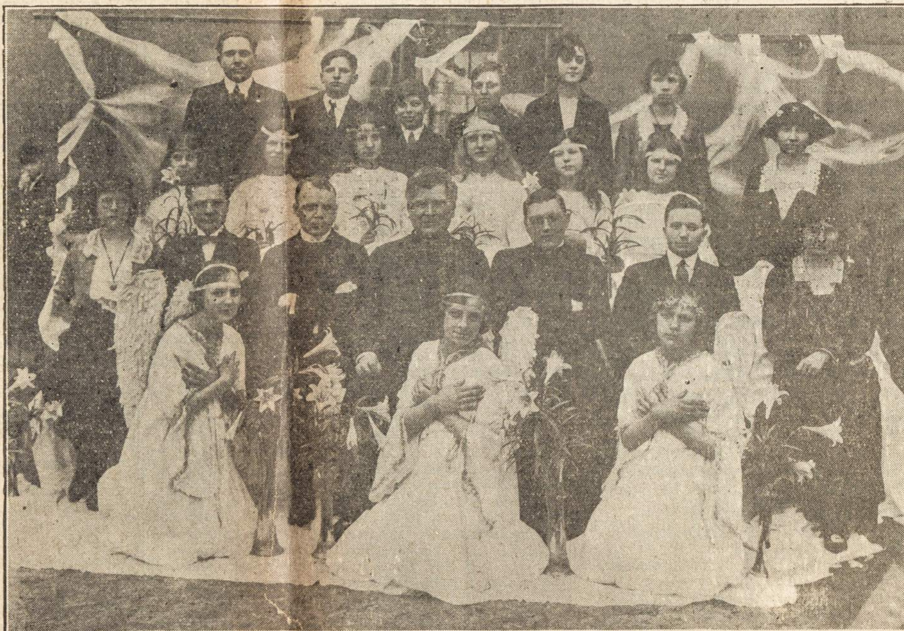
VAIZDAS PAGERBIMO VARDUVIŲ TRIJŲ JUOZŲ:

1919 met. pinigų surinkta $1,208.66, 1920 m. — $270.73, 1921 m. — $62.77. Viso $1,542.16.