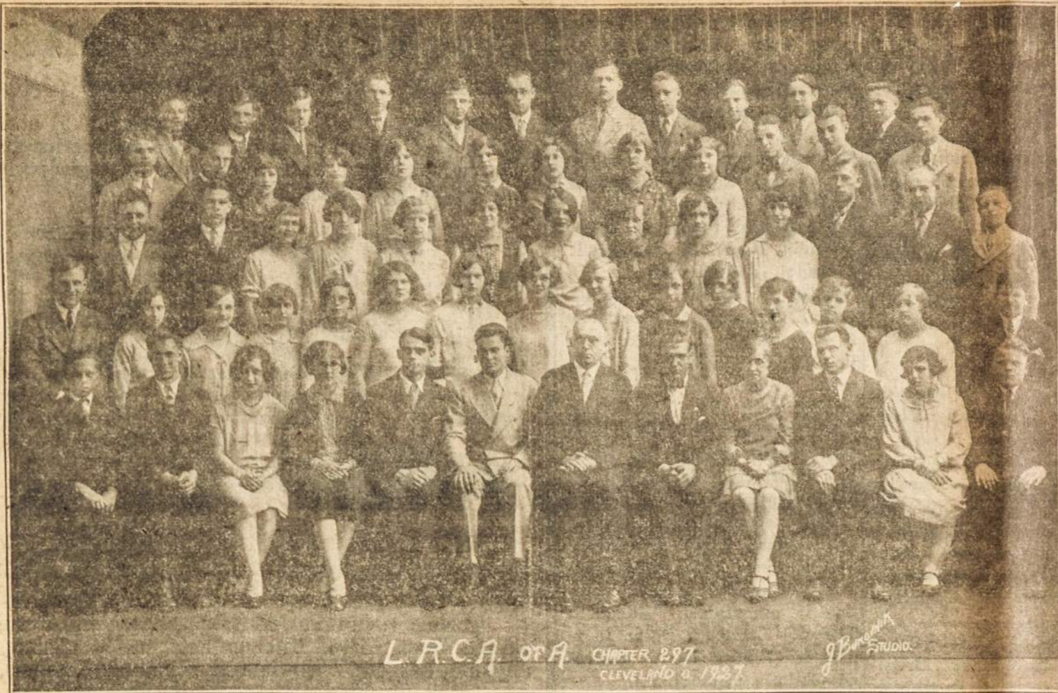
L.R.K.S.A.M. CHAPTER 297 CLEVELAND, OHIO