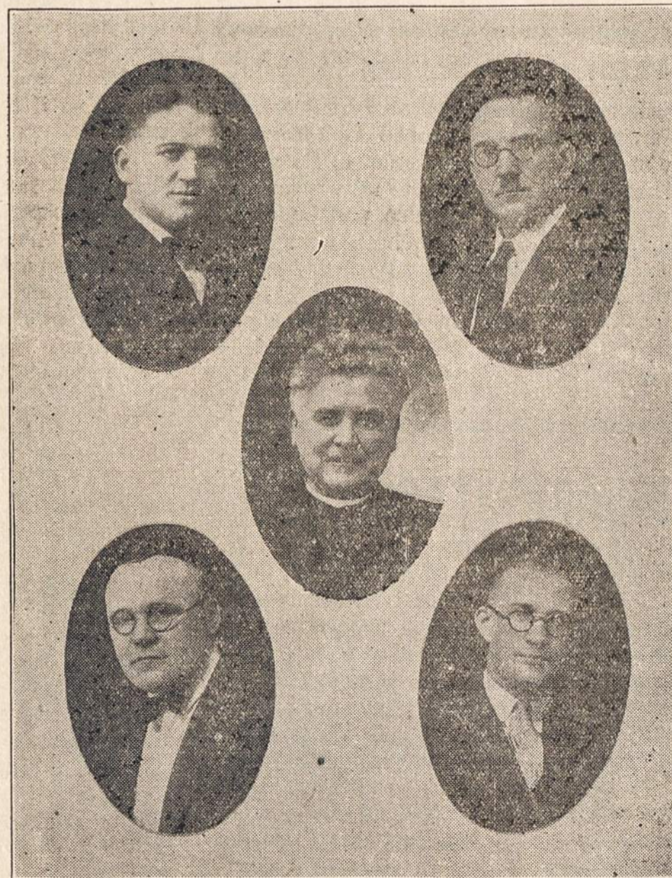
DAINOS DIENOS KOMISIJA.