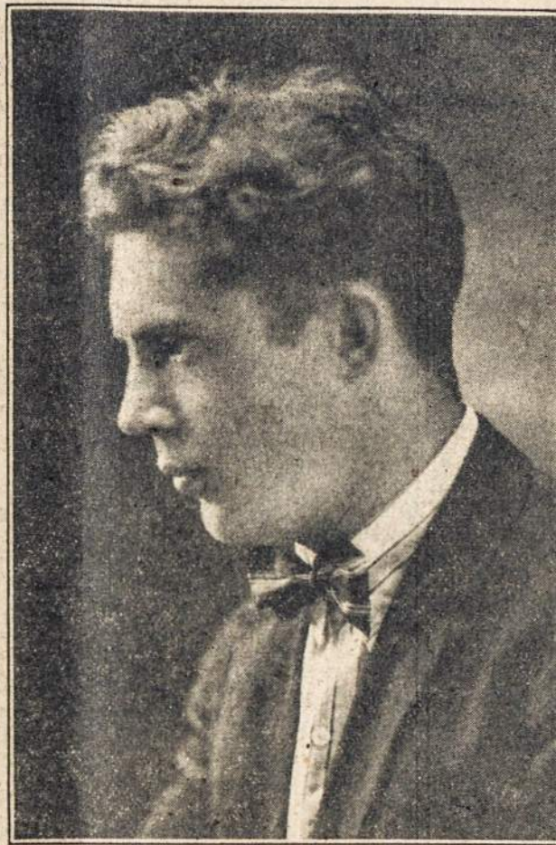
ARTISTAS J. DINEIKA.

Gal but, Vilniaus vadavimo valanda visai netoli. Budėkim!