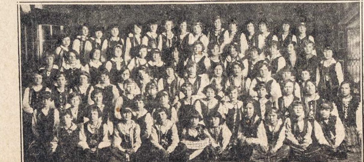
Šv. Agnietės Jaunamėčių Koras, Pittston, Pa.

United States Lines 45 Broadway (Phone, Whitehall 2800) New York City