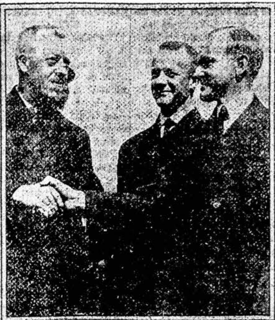
Prezidentas Coolidge Vašingtone priima ir sveikina orlaivio ZR-3 vada, dr. Eckner.