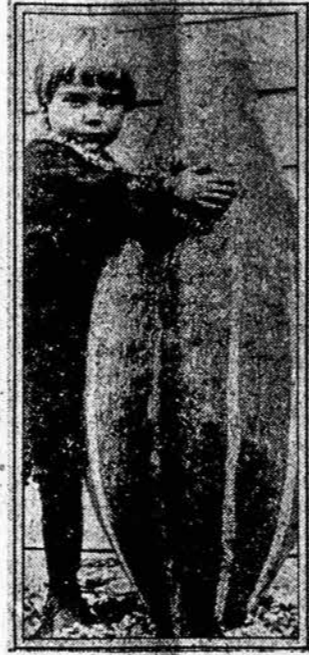
Ar kuomet nors matėt tokį didelį arbužą? Tai yra beveik keturių metų ilgio.

Buffalo. — Gubernatorius Al. Smith savo kalboje pasmerkė prezidentą Coolidge už tyčijimą kas link Ku Klux Klanų.