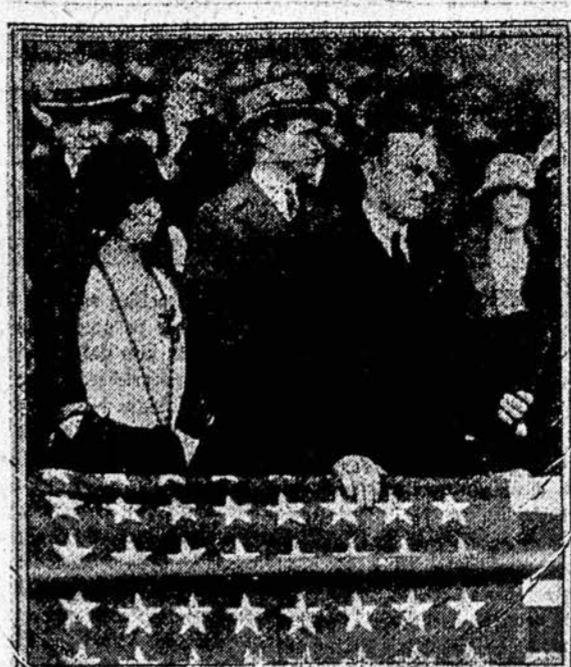
Prezidentas Coolidge ir jo žmona tėmija "baseball" žaidimą Vašingtone.