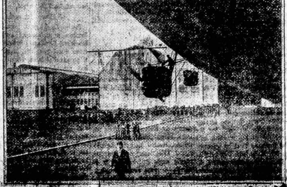
Diržabalas, 22-3 pasirengs išvykti per Atlantiką į Vėbes

KALEDOMS EKSURSUIJĄ I LIETUVĄ P. A. V. Bis- ca. Suvaidyti Valstijų Liet- jos rengia epoci- ale Kaledoms Ekskursiją I Lietuvą. Pas- žiornai išplauks ant didžiojo "Le- vianth" nuo New York'o, Grupd- zio 6 d. per Southampton'ą. Jus pasioksite savo tėvyne laiku suet su draugais ir gimineis, del Kale- dy švenčių. Pasišturinkit šie ekskursija da- bar. Jus gausite mažiausiais lė- šomis, svačius, puikius kambarius, geriausias valgį, didelius ir primus publikos kambarius ir maunęgų pa- tarnavimą per visą laiką. UNITED STATES LINES 45 Broadway, New York City Managing Operators for United States Shipping Board