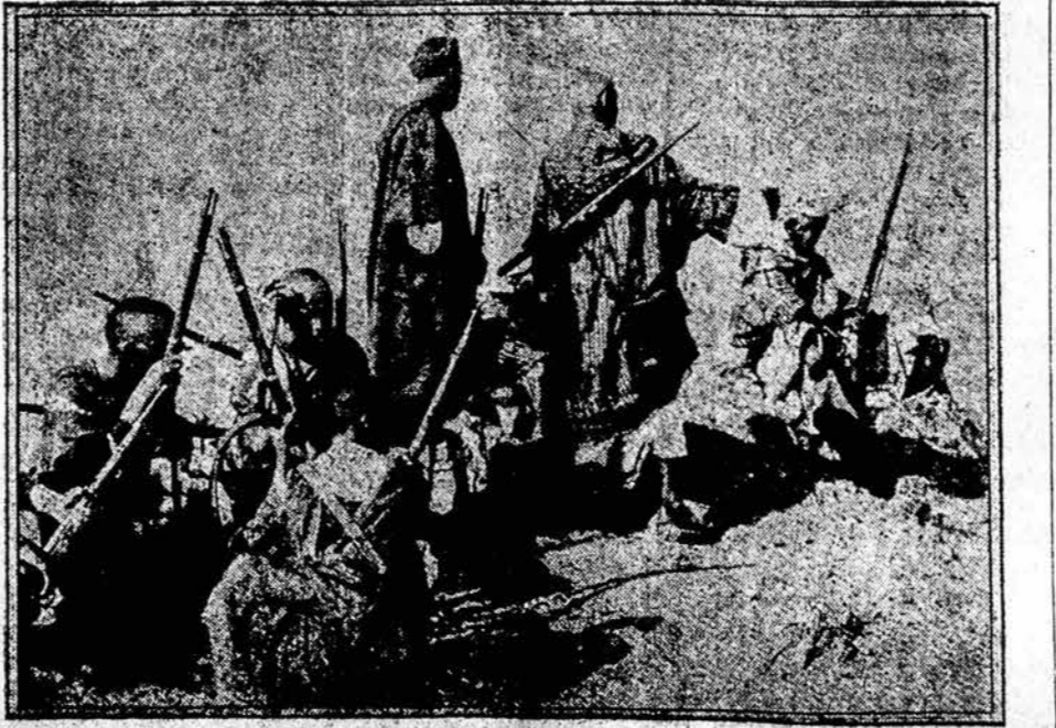
Apsiginklavę marokiečiai, kurie kovoja su ispanų kariuomene.