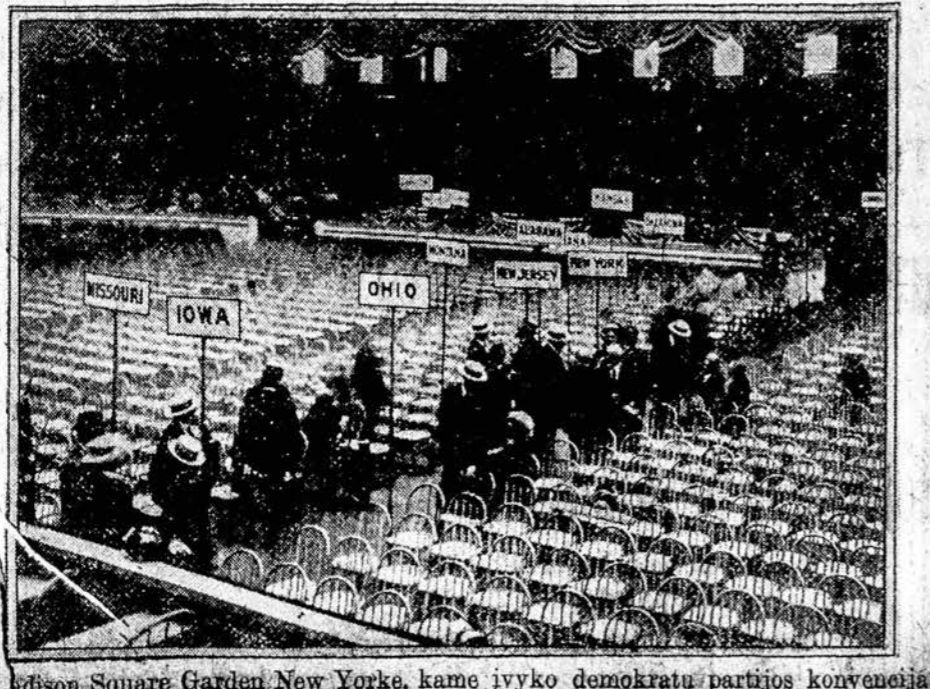
Madison Square Garden New Yorke, kame ivyko demokratu partijos konvencija.