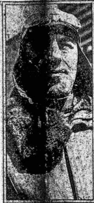
...laivių ekspedicijos aplink pasaulį, vad...

Lietuvos atstovas Generalojo pareiškė Tautų Sąjun-