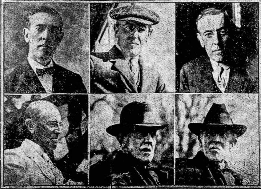
Seši mirusiojo prezidento Wilsono atvaizdai.