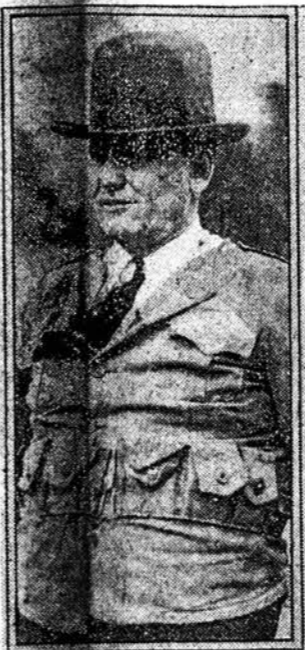
Iowa valstybės senatorius Smith W. Brookhart, kuris kas savaitę medžioja Maryland ir Vilginija kalnuose.

Vašingtonas. — Filipinų salų specialiai atvykusi misija įteikė Senato tam tikrai komisijai nepriklausomybės reikalavimą.