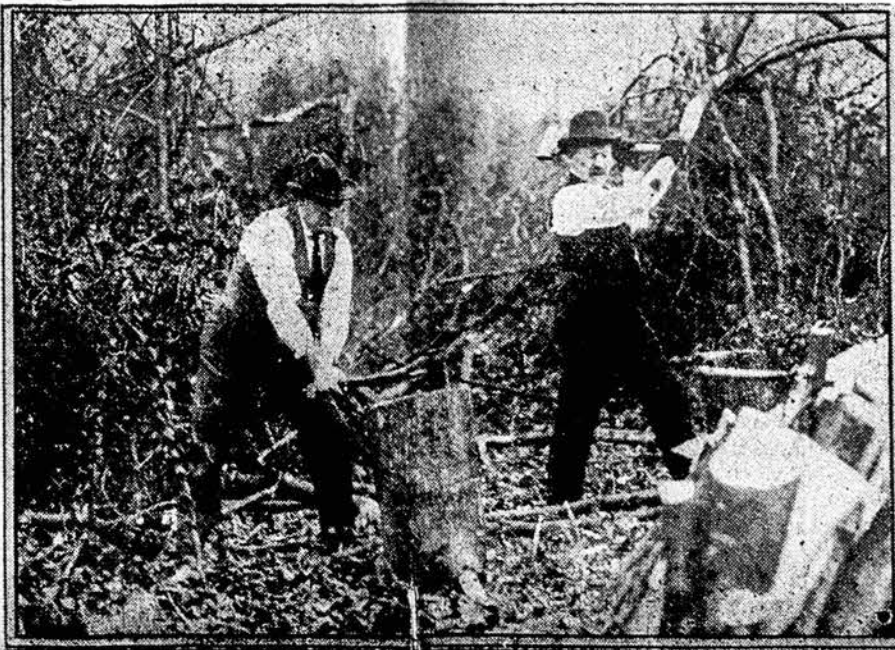
Senatorius Magnus Johnson ir senatorius Frazier skaldo malkas.

2,600 grūdų organizacijos padarė $490,000,000; 1,841 pienininkystės produktų organizacijos padarė $300,000,000; 1,182 gyvulių organizacijos padarė $220,000,000 ir 956 vaisių ir daržovių organizacijos padarė $280,000,000; 78 vaotos organizacijos padarė $100,000,000 ir 14 tabako organizacijų padarė $132,000,000.