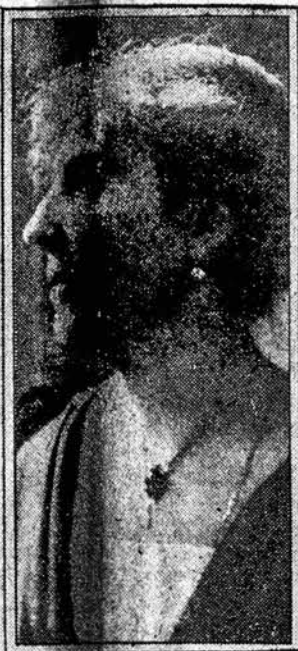
P-ni Havel Hward naujojo Anglijos ambasadoriaus Amerikon žmona.

Naujasai Amerikos konsulas A. E. Carlson jau išvažiavo užiūti savo vietą Kaune.