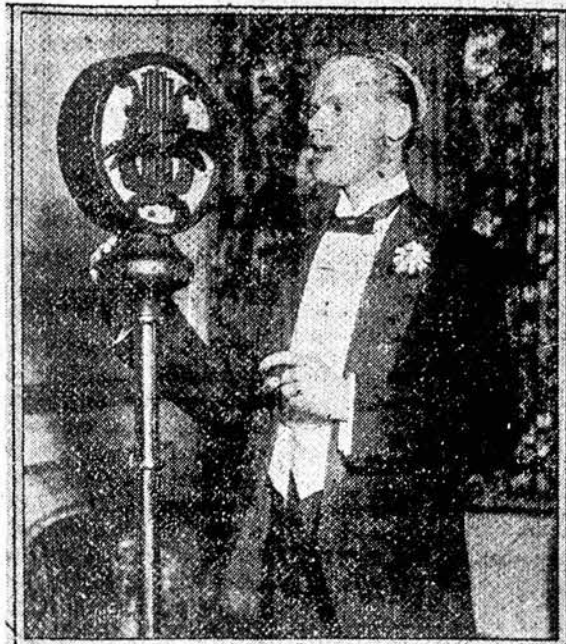
Anglijos orlaivių sekr. pagelbininkas kalba per radio.

Lietuva. Kaunas, Ožėškienės g., 12 nr. "Pavasario" Administracija.