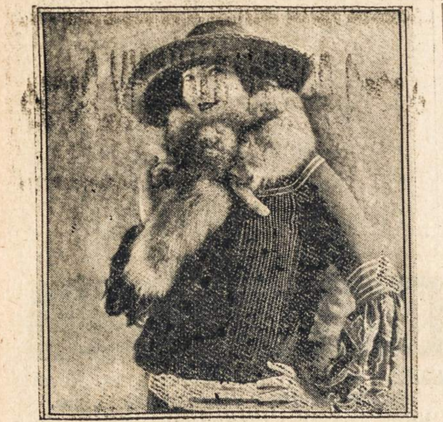
Garsi aktorica Priscilla Dean pasirėdžiusi sulig vėliausios mados.

499 Grand Str., Cor. Union Ave., Brooklyn, N. Y. 420 Lorimer St., Brooklyn, N. Y. Telephone Stagg 3929. 20 Oceanview Ave., Jamaica, L. I., Teleph. Jamaica 3137-W 486 Fulton St., Cor. 168 St., Jamaica, L. I., Tel. 7394 Jamaica 120—05 Liberty Ave. (120th St.) Richmond Hill, L. I.