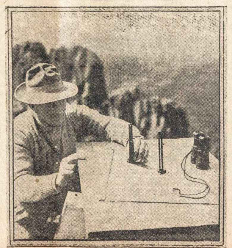
Miškų valdininkas saugoja Pike National Forest, Colorado miškus nuo gaisrų.

Rugpjūčio 29 d., Sv. Mykolo parapija turėjo ekskursijas, kurios įvyko "Moosy ežere." Iš ryto apie 9 val. keturi gatvekariai pribuvo į W. Seranton, kuriuose susėdo lietuviai ir nuvažiavo į paskirtą vietą. Pasitaikius gražiai dienai, tad ekskursijos buvo įdomios. Žmonės pribuvo prie viršminėto ežero: vieni ejo mau-