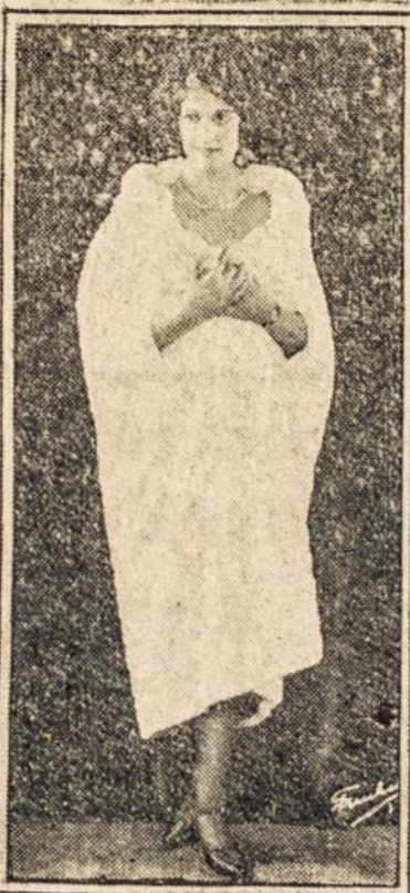
Moterys sako, kad tai gražus, naujausias mados, vakininis apsiaustas.

New Orleans, Louisiana primena atvykimą francuzų į Šiaurį Amerikos kontinentą. 1718 m. francuzai įsteigė fortą apsaugoti vartus į Mississippi klonį. Naujas miestas buvo pavadintas Nouvelle Orleans, po Francuzijos regento, Orleans kunigaikščio.