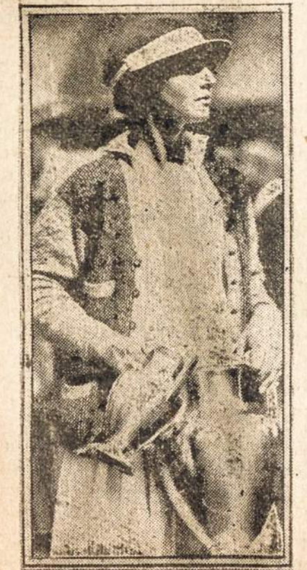
P-lė Helen Wills, kuri laimėjo "tennis" čempionystę Amerikoje, pralenkdama po nią Mallory.