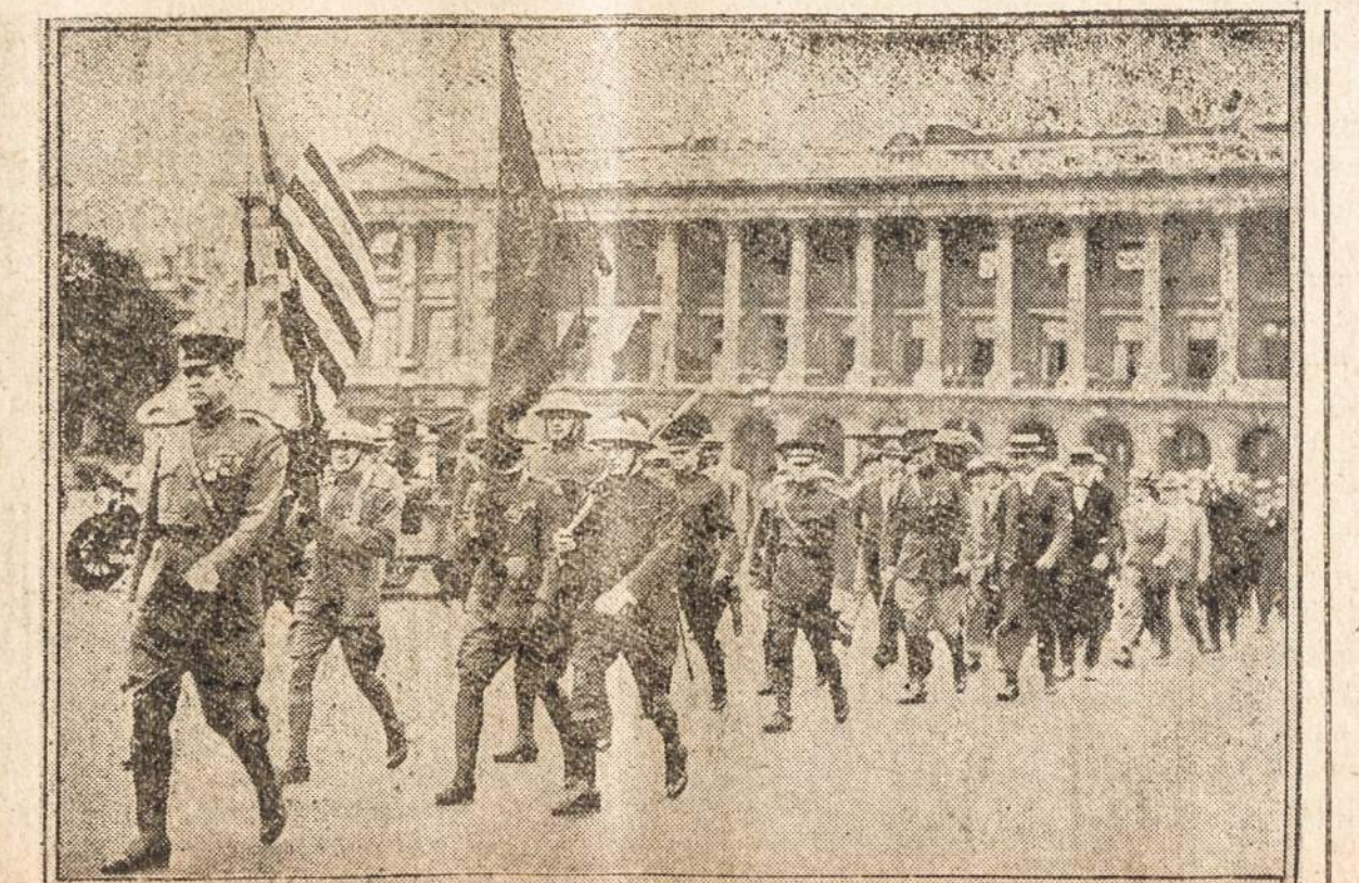
Amerikos Legijonieriai Paryžiuje parodoja išgirdę apie prezidento Hardingo mirimą. Paroda seka visi Paryžiu gyvenantieji Amerikos piliečiai.